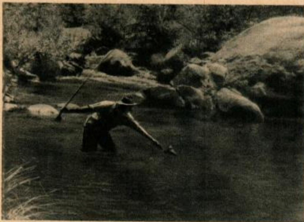
Pêche dans l'écume qui se trouve entre les rochers d'amont. Le leurre n'est pas muni d'un plomb et va se loger dans le lac profond à côté du rocher. Ici il a été pris par une perche de belle taille. Le pêcheur a laissé le lac et il est revenu plus tard au même endroit pour une autre tentative.

Les barrages établis par les castors sont souvent des endroits remarquables pour la pêche des truites. S'approcher du bord du lac en faisant attention aux ombres que le corps projette contre le ciel. Utiliser un leurre naturel car il y a trop peu de courant pour mouvoir un leurre artificiel. Le lancer du leurre est difficile, mais souvent il rapporte de belles pièces.