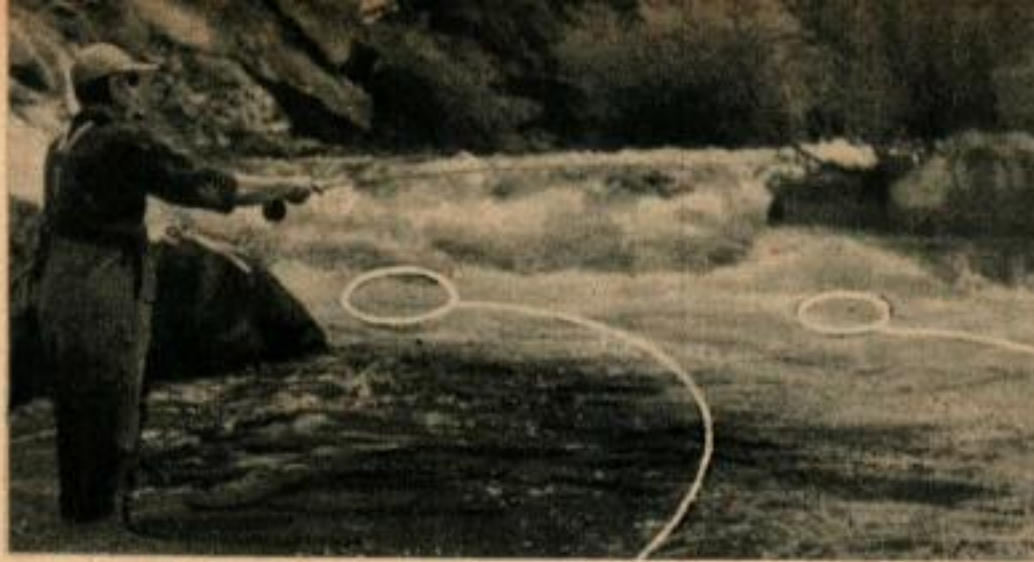
Avant d'entrer dans l'eau, le pêcheur lance son leurre dans l'eau écumante au delà du rocher et regarde s'il vient vers lui dans la partie calme où il se tient. Dans la position représentée, six essais ont rapporté deux truites. Sur la photo ci-dessus, le pêcheur lance son leurre dans le courant rapide et laisse le courant le porter en un endroit plus tranquille.