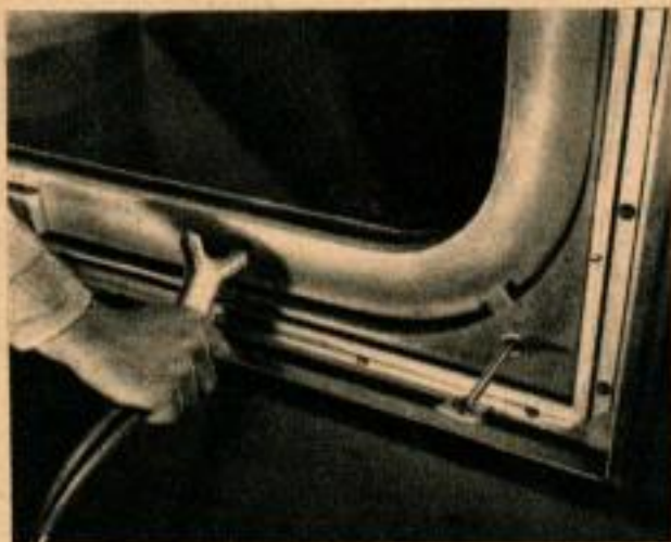
Cet outil en Y dégonfle et regonfle un joint pneumatique en caoutchouc, avant et après le nettoyage des vitres. Ci-dessous: les vitres pivotent autour d'un axe vertical, pour que leur lavage soit particulièrement facile à faire. Le petit chariot porte un moteur et un compresseur alimentant l'outil ci-dessus.

Le mur extérieur est une mince feuille d'aluminium embouti par panneaux de 3 mm (1/8 in.) d'épaisseur seulement. On a boulonné d'abord, sur les poutrelles d'acier de la charpente du gratte-ciel des montants spéciaux. Les panneaux, hauts d'un étage, ont ensuite été hissés facilement et boulonnés sur ces montants par une petite équipe d'ouvriers restant à l'intérieur du gratte-ciel. Le mur intérieur est formé de quatre couches superposées de béton dit « perlite », projeté par des pistolets spéciaux, à l'air comprimé, sur un lattis d'aluminium rainuré, à entretoises d'acier. De telles méthodes ont permis la réalisation d'un gratte-ciel solide, moderne, et à bas prix.