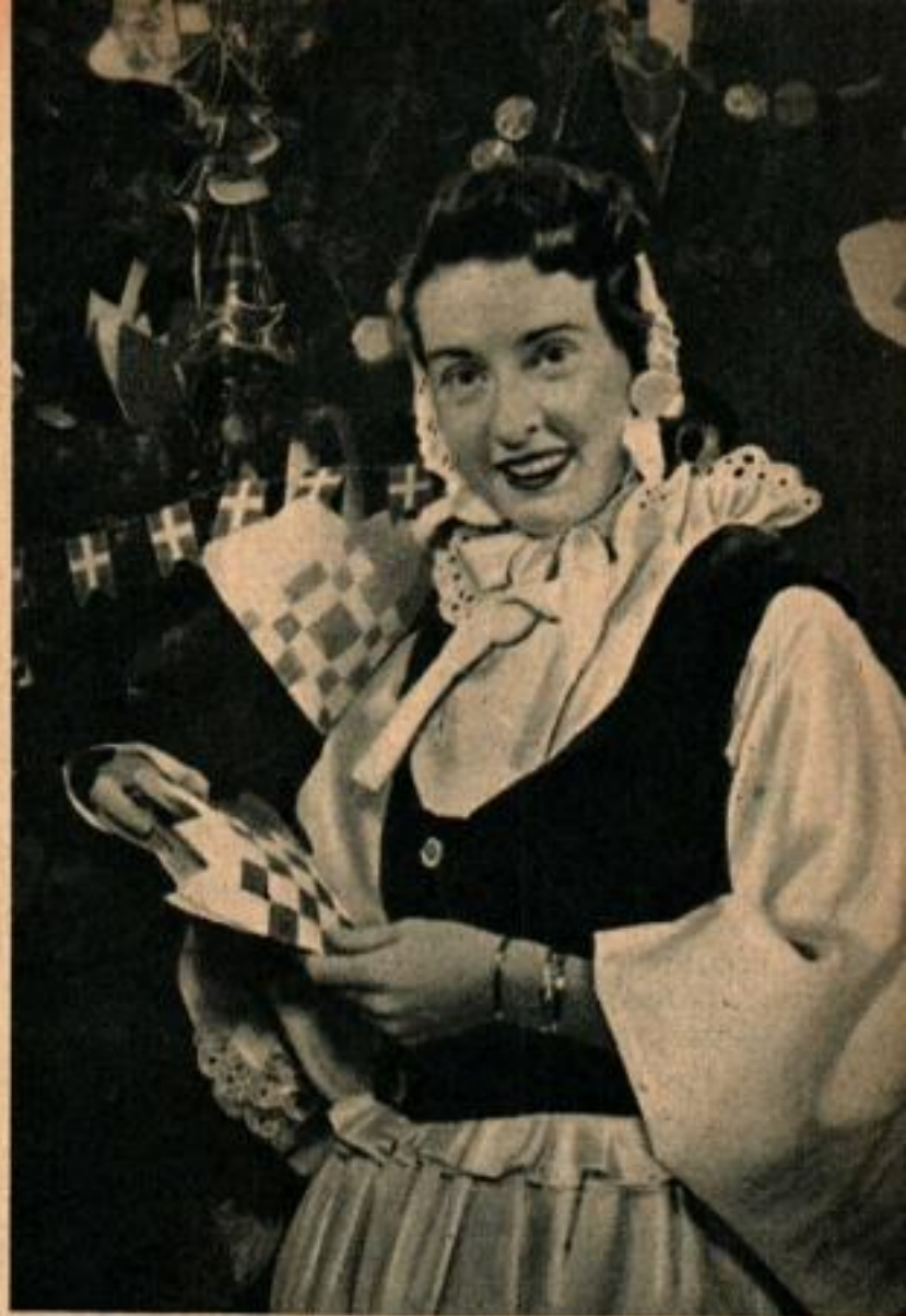
Les papiers décorés d'échiquiers servent à faire des sacs dans lesquels les Danois mettent les bonbons et les gâteaux de Noël.

L'arbre de Noël américain est, comme la nation américaine toute entière, un résumé