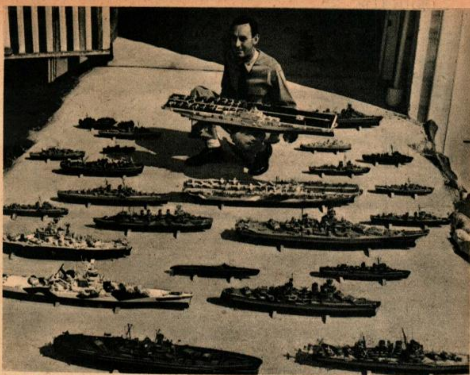
Se flotte comprend en tout cinquante-trois unités, toutes à la même échelle. On en voit ci-dessus quelques échantillons variés. Le navire que le commandant tient dans les bras est un porte-avion de la classe Essex. On peut voir également un sous-marin, un croiseur, un bateau de débarquement, des escorteurs, etc. Ci-dessous, à gauche, pose d'un canon de D.C.A. sur un cargo. À droite, installation d'un canon sur un navire de la classe South Dakota. À l'avant, une batterie de trois canons de 406 mm.