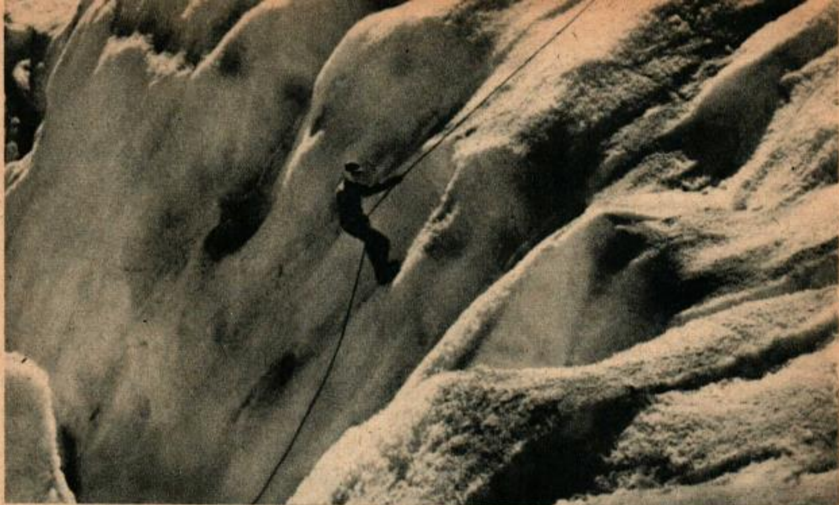
L'alpinisme fait partie de l'entraînement des aviateurs d'Alaska, ceux qui font partie du fameux 10 e Escadron de secours.

dron de Secours, dirigé pendant plusieurs années par le colonel Bernt Balchen, vétéran des expéditions arctiques, ont exploré l'Alaska, le Canada du Nord et les océans polaires, au cours de missions de secours ou de reconnaissance.