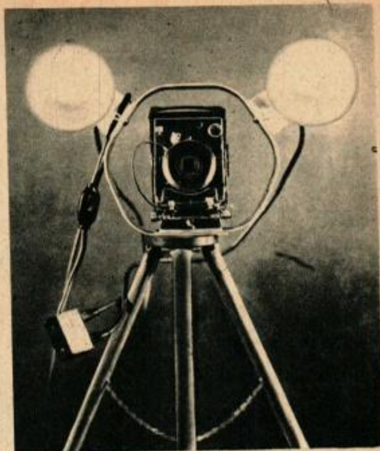
L'appareil photographique étant derrière les floods, il est bon de masquer l'entrée de l'objectif au moyen d'un pare-soleil.

de la page 94, on voit que les prises sont à trois paires de contacts chacune, mais qu'il faut couper une des bandes de tôle mince réunissant certains contacts et souder des fils entre certains autres. On doit arriver à réaliser le schéma de couplage série-parallèle représenté en bas et à droite du croquis. On peut également se servir plus simplement de quatre prises de courant à deux trous chacune, que l'on monte comme sur le schéma de câblage du croquis. Selon que l'on met les deux prises à fiches des lampes dans les prises de droite ou de gauche, on a l'allumage en parallèle à forte intensité lumineuse ou l'allumage en série à faible intensité lumineuse pour les réglages. Le câble d'alimentation est un fil de forte section recouvert de caoutchouc et doit avoir une longueur d'au moins 4 à 5 m. Les fils de chaque lampe n'ont qu'une longueur de 1 m.