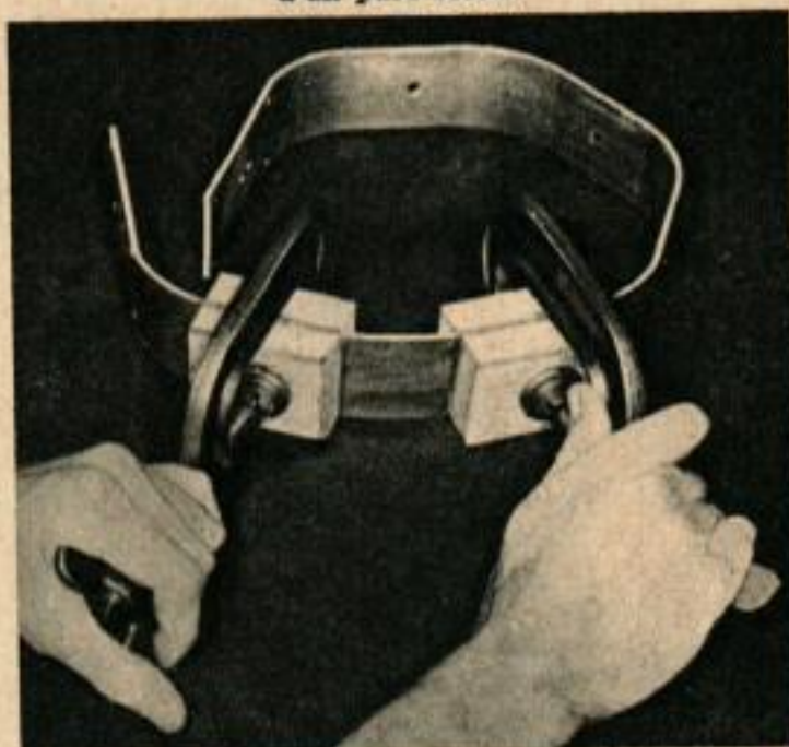
Ci-dessus, pliage de la bande de tôle au moyen de presses à coller et de cales en bois. Ci-dessous, les trous dans les oreilles sont faits à la scie à découper.