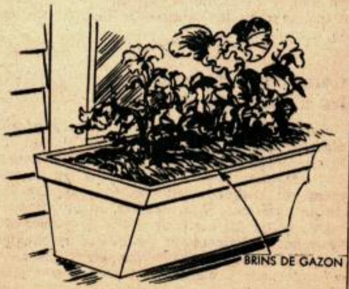
BRINS DE GAZON