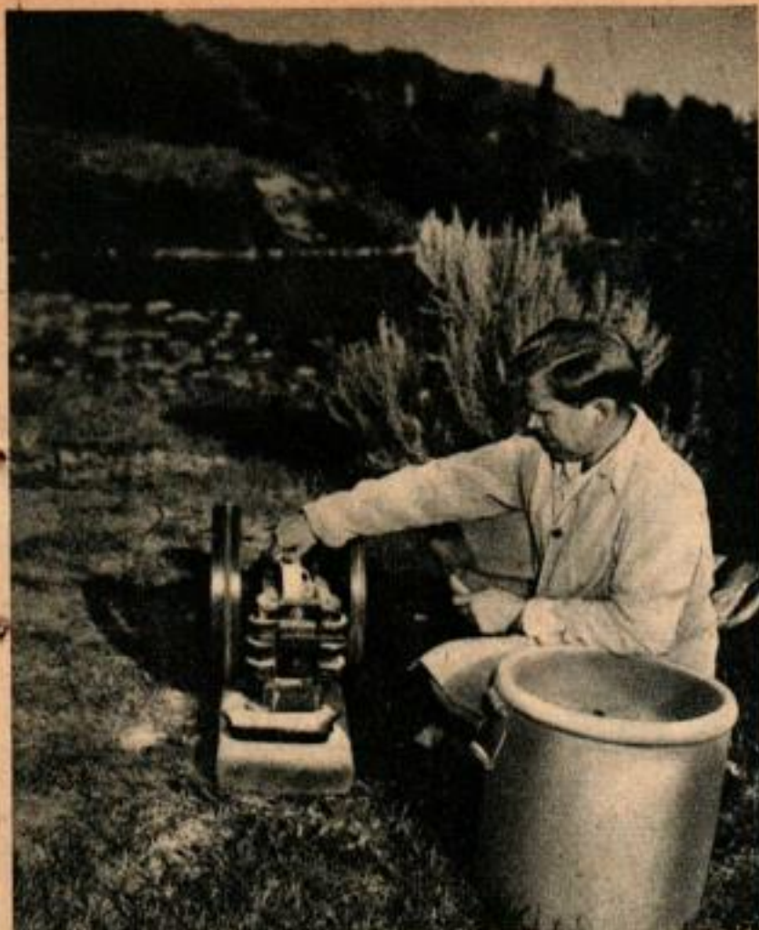
Le broyeur à minéral sert maintenant à broyer les poteries ratées. La matière peut ainsi être utilisée de nouveau.

Les Bowler ont adopté un petit garçon qui, récemment, tomba malade. Transporté à la clinique, il reçut une injection de pénicilline. Les parents étaient bien soucieux et préoccupés, mais le soir, la fièvre tomba et le petit s'endormit; l'horloge marquait 11 heures. Pourtant ils ne voulurent pas admettre que ce