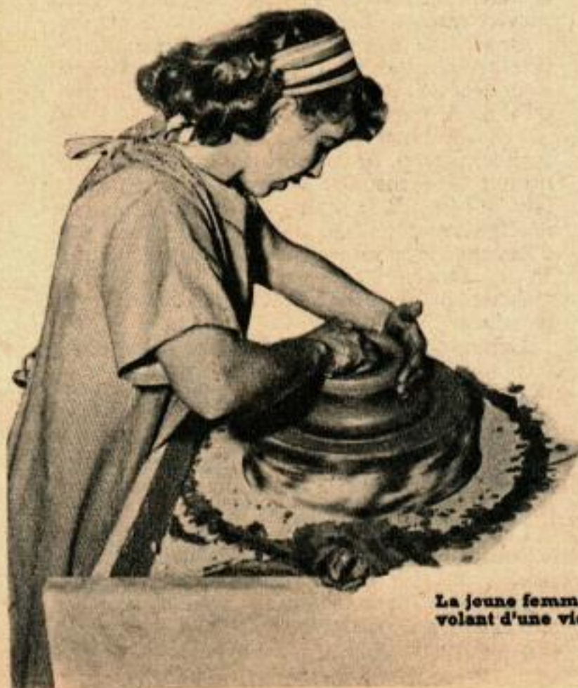
La jeune femme façonne un vase sur le tour que son mari a fait avec le volant d'une vieille voiture, deux vieux blocs-moteurs et une forte dose d'ingéniosité.

L'humidité et la température ont une grande importance dans l'art de la céra-