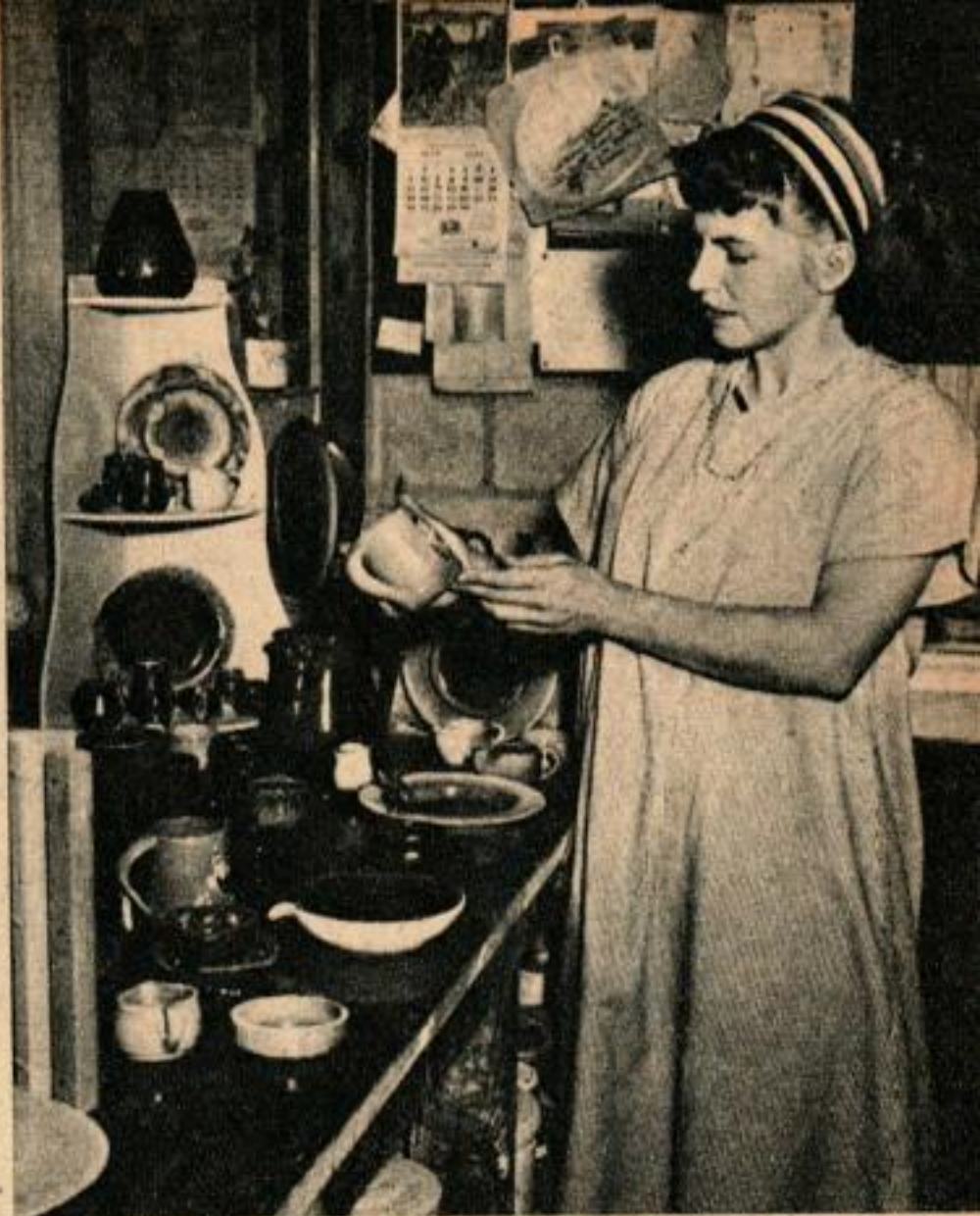
Les Bowler ont consacré à la céramique leur impérieux besoin de création artistique. Les motifs principaux sont empruntés à l'histoire de l'Ouest américain.

En juin 1947, les Bowler chargèrent leur four sur une remorque, derrière leur jeep, avec une chèvre qu'ils avaient achetée pour avoir du lait à meilleur compte. Leur destination était, dans le sud