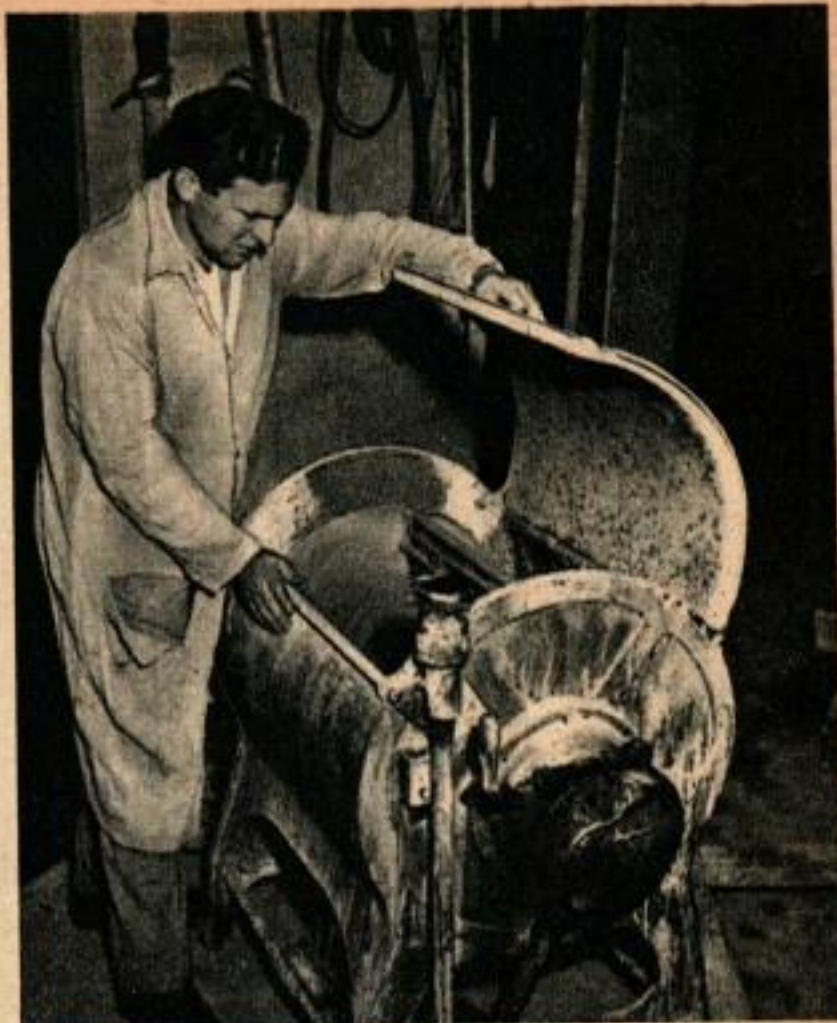
Bowler a converti en malaxeur une ancienne machine à laver: en deux heures, elle traite la provision d'argile d'une semaine.

fût la nuit et, endossant leurs blouses, ils mirent le tour en marche pour sentir l'argile humide prendre forme entre leurs mains. Il leur semblait que leur fatigue s'évanouissait à mesure que la roue tournait: les Bowler étaient dans l'ivresse de la création et, entre leurs mains, tenaient leur bonheur.