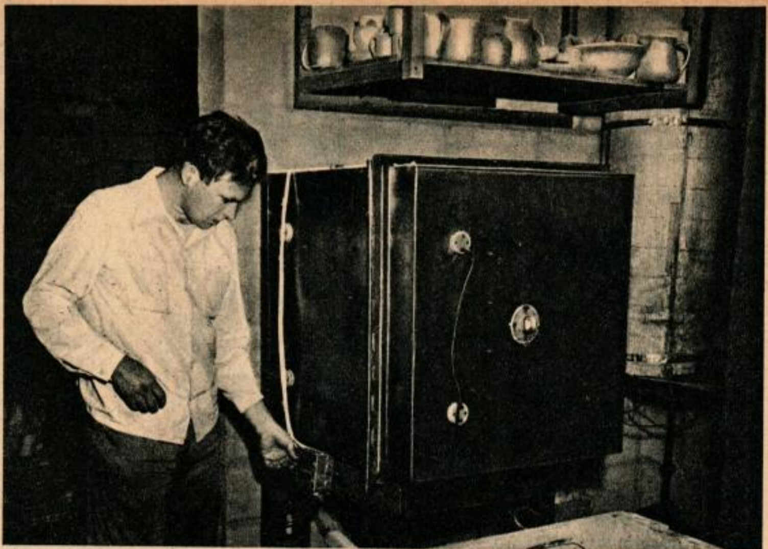
Le four est fait d'éléments récupérés. Six interrupteurs électriques permettent de régler la température avec précision.

mique; il y fallait aussi de l'ingéniosité et de l'improvisation.