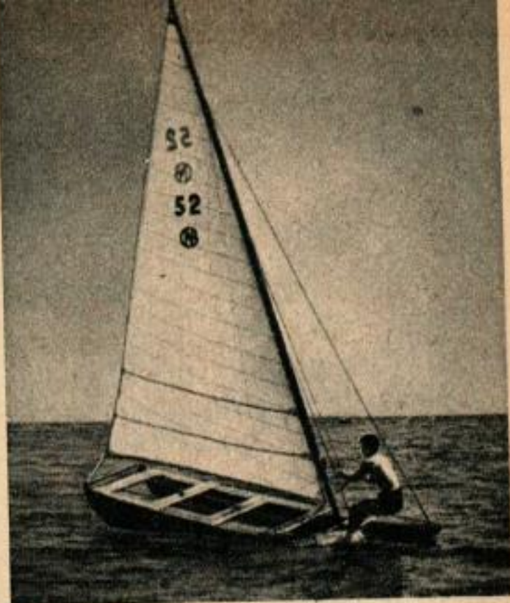
Cette photo (selon le constructeur) prouve que le yacht à coques jumelées peut naviguer sans différence de calaison.