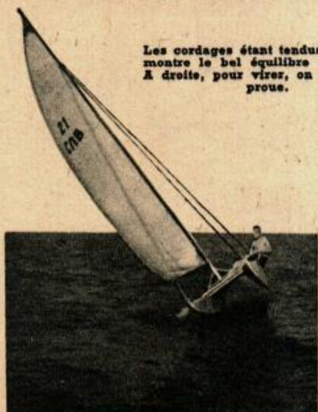
Les cordages étant tendus, le marin montre le bel équilibre du bateau. A droite, pour virer, on soulève la proue.

une seule coque et peut renverser sa direction presque instantanément si on le fait piquer du nez en tirant sur l'avant avec une corde. L'engin est construit en bois léger (rare en Espagne) et ne pèse que 85 kg. Le modèle favori des amateurs espagnols a 6 mètres de long, un mètre de large et son mât a une hauteur de 6,50 m. Ses coques jumelées n'ont que 55 cm de haut. La voile comporte 13 mètres carrés de toile.