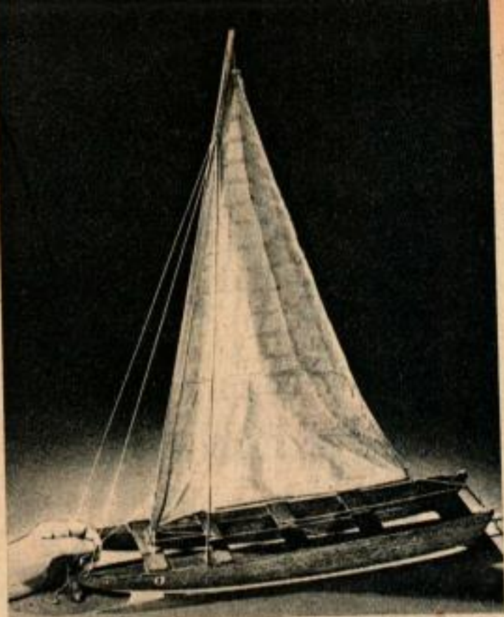
Un modèle réduit du catamaran montre les traverses qui servent à grimper dessus.