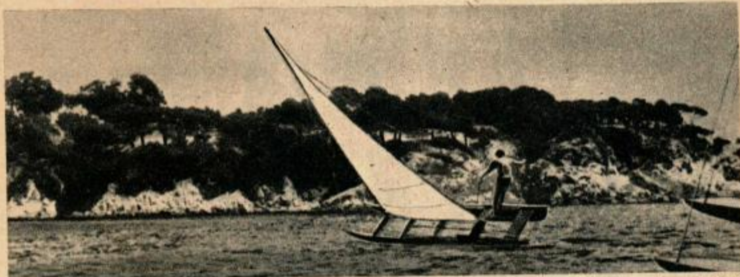
Un marin habile montre qu'il suffit d'une main pour manœuvrer ce bateau tout en faisant un virage sur une seule coque. Ci-dessous, concurrents d'une course en Méditerranée, sous les auspices de la Fédération espagnole des clubs nautiques.