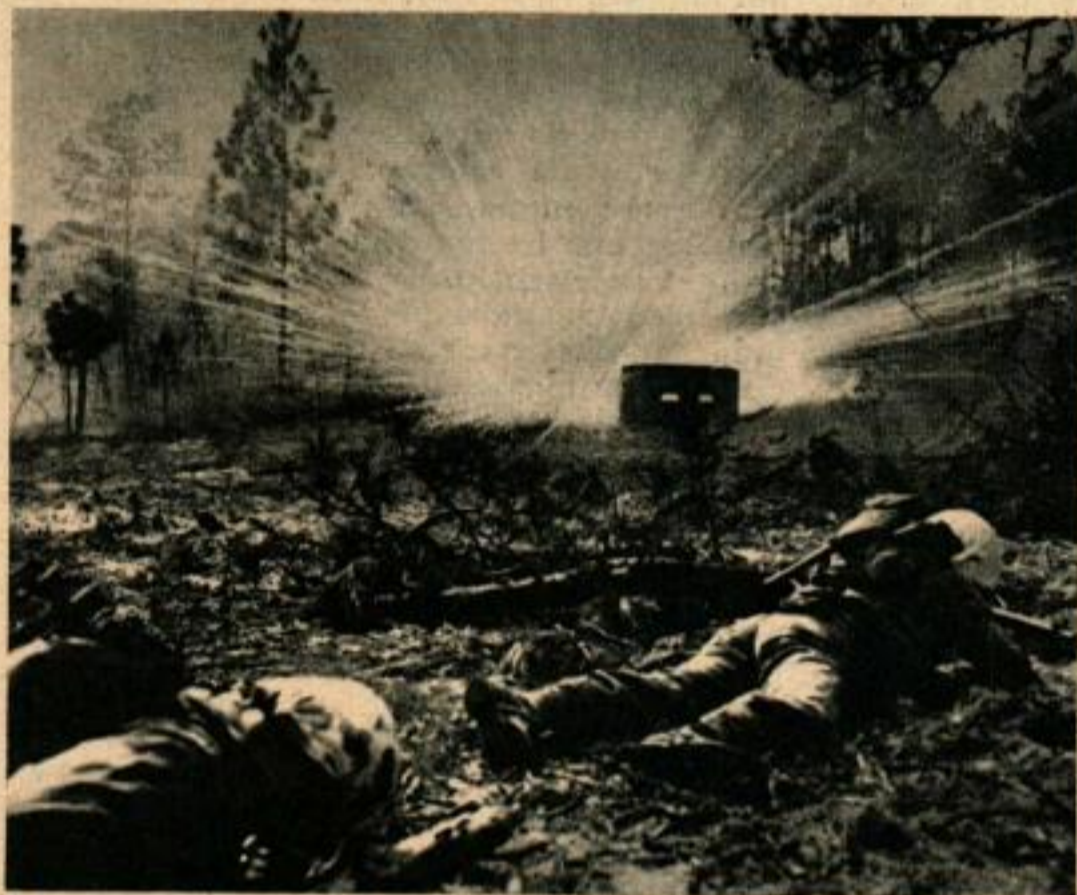
Les hommes attendent l'explosion de la bombe au phosphore près du nid de mitrailleuses. Une fraction de seconde plus tard, ils se précipiteront en avant, dans cet exercice d'attaque d'une position fortifiée.

des heures à plonger pour étudier les courants et le terrain sous-marin, au large de la plage de débarquement. D'autres, rampant dans des uniformes de camouflage, étudient l'état de la plage, les pentes, le sable, les rochers, les galets, et en notent les dangers. Travaillant furtivement, ils s'avancent à l'intérieur pour sonder les forces de l'ennemi, sa puissance de feu, ses positions d'artillerie, les routes et les ouvrages de défense.