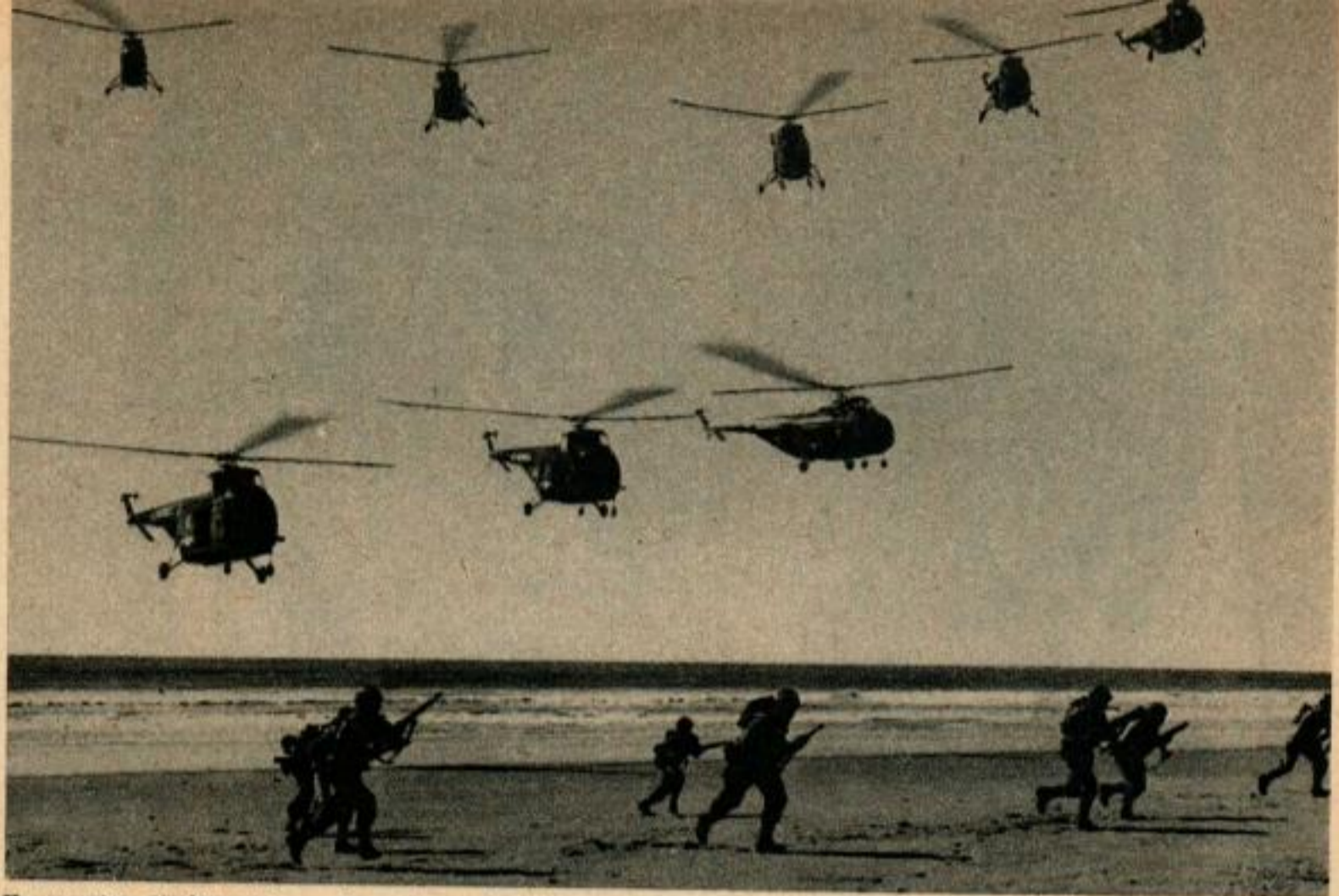
Un essaim d'hélicoptères planants, prêts à descendre avec des approvisionnements pour les Marines qui chargent sur une plage.

fictifs, ou transportant une cargaison de 900 kg aux unités isolées. « Nous pouvons les faire descendre presque n'importe où », dit le major. « J'en ai même fait descendre un sur le versant d'une colline, les roues d'un côté touchant seules le sol, l'appareil soutenu par son rotor pour le reste. Les soldats sautaient du côté inférieur et nous décollions. »