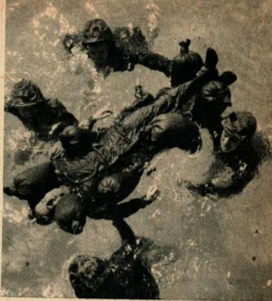
Dans un exercice de sauvetage, les recrues apprennent à faire flotter les victimes sur des flotteurs faits de pantalons noués.

le corps-à-corps; pratique le judo, le combat au couteau et à la baïonnette. Il descend sur des filets accrochés à une tour de 12 mètres, ou charge en partant d'un chaland de débarquement. Sur le terrain d'exercice, le rythme ne ralentit pas et les brimades sont planifiées. Si une recrue ne pivote pas sur le pied convenable, on lui marche sur le pied : « Maintenant, tournez sur celui qui fait mal », grommelle l'instructeur.