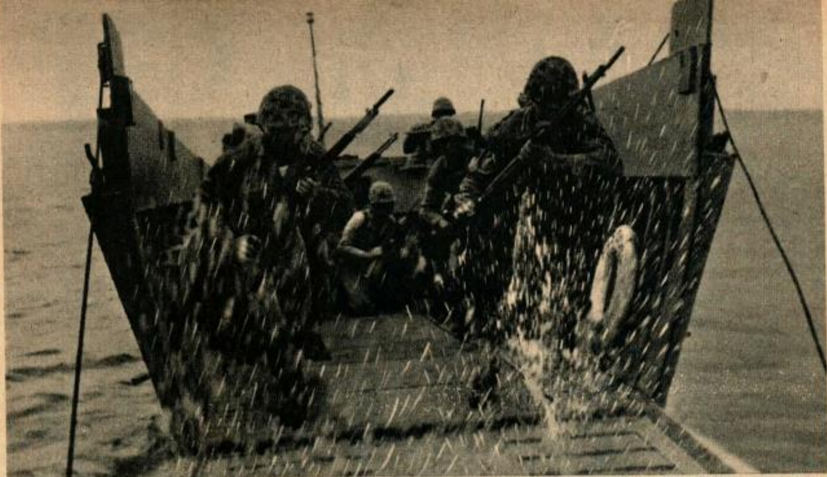
La rampe d'un bateau de débarquement se rabat à grand fracas et les hommes se précipitent sur la plage, au cours d'un exercice de débarquement.

de bataille, servant à gagner des guerres et, parfois, à sauver la vie de la recrue qui se plaignait le plus. Ces huit semaines peuvent être les plus rudes de la vie d'un « Marine ».