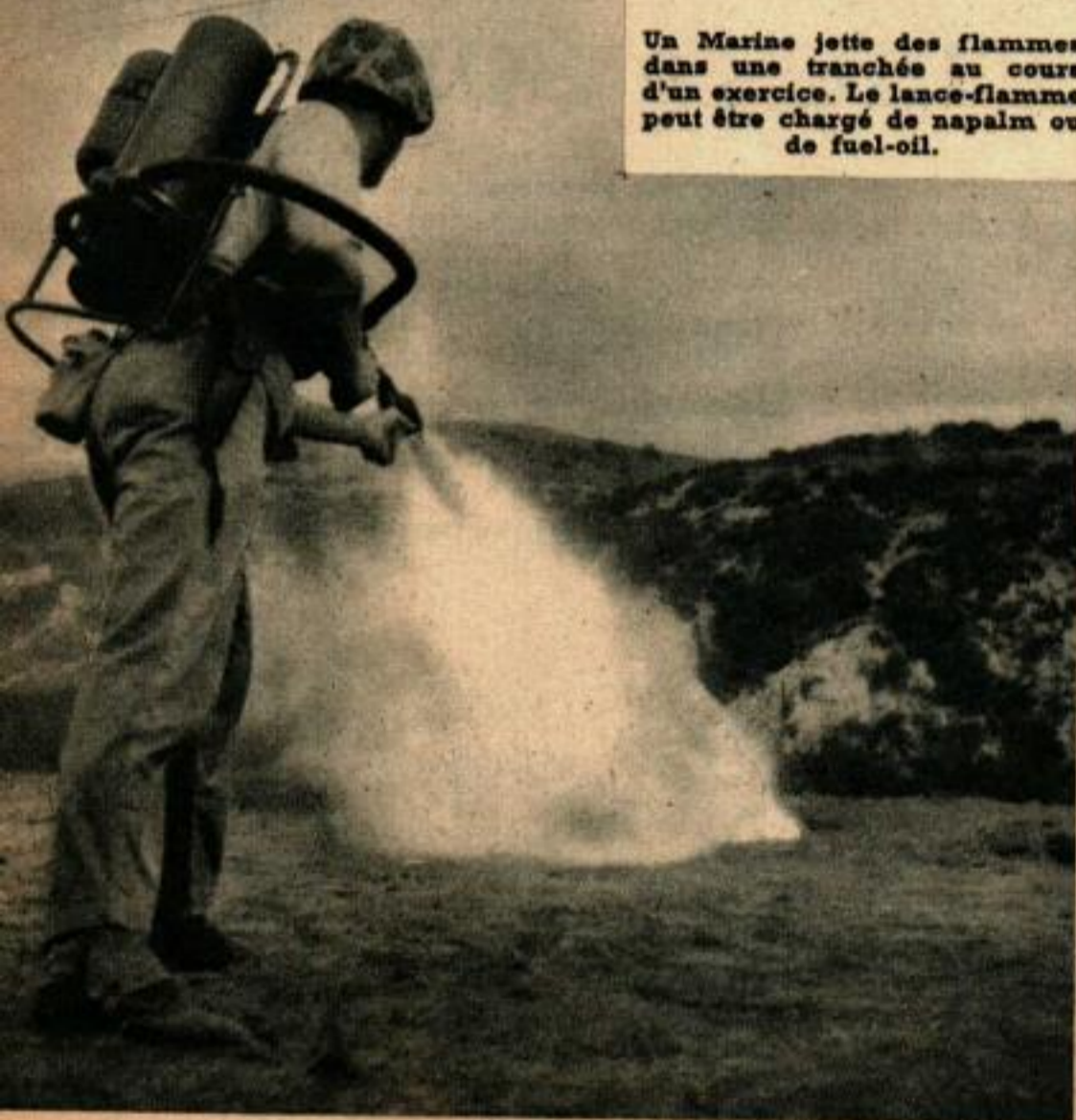
Un Marine jette des flammes dans une tranchée au cours d'un exercice. Le lance-flamme peut être chargé de napalm ou de fuel-oil.

jusqu'à ce que toute une compagnie de 250 hommes eût été déposée sur l'inaccessible sommet.