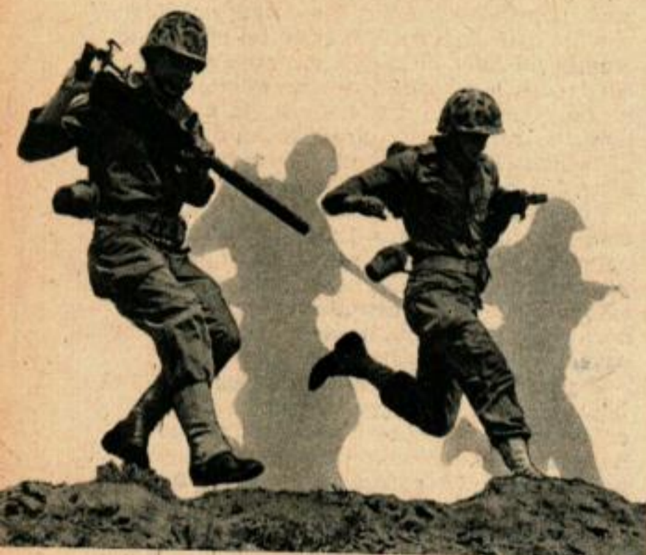
Deux Marines font une rude course, en portant une mitrailleuse légère.