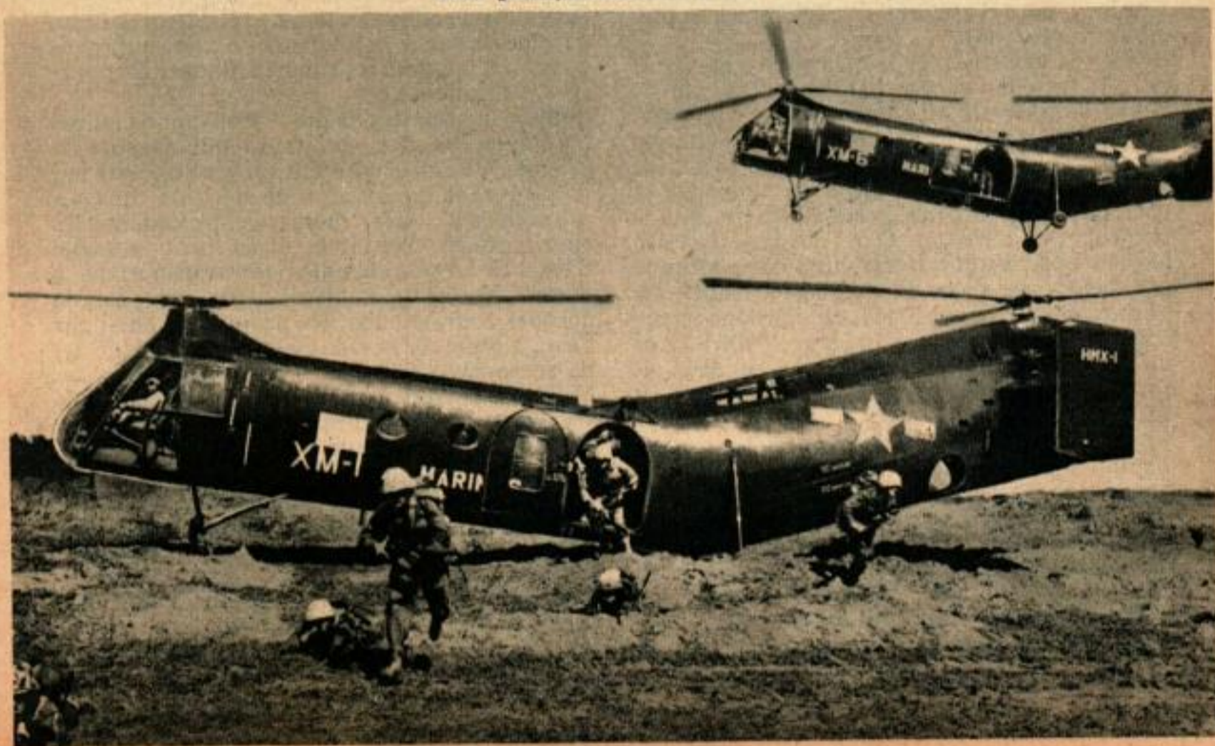
La « banane volante », autre type d'hélicoptère, décharge sa cargaison en quelques secondes, tandis qu'un autre plane, attendant son tour.

Bien qu'ils ne soient pas si gros ni si encombrants que les vieilles « bananes volantes », les nouveaux hélicoptères transportent un chargement plus important et ne sont pas handicapés par un centre de gravité scabreux. Les hommes peuvent se déplacer à l'intérieur. Ils sont soulevés par un rotor au lieu de deux et font 180 km à l'heure en vitesse horizontale. Ils sont constamment en service, déposant des renforts sur les lieux élevés, enlevant les patrouilles et les blessés des champs de bataille