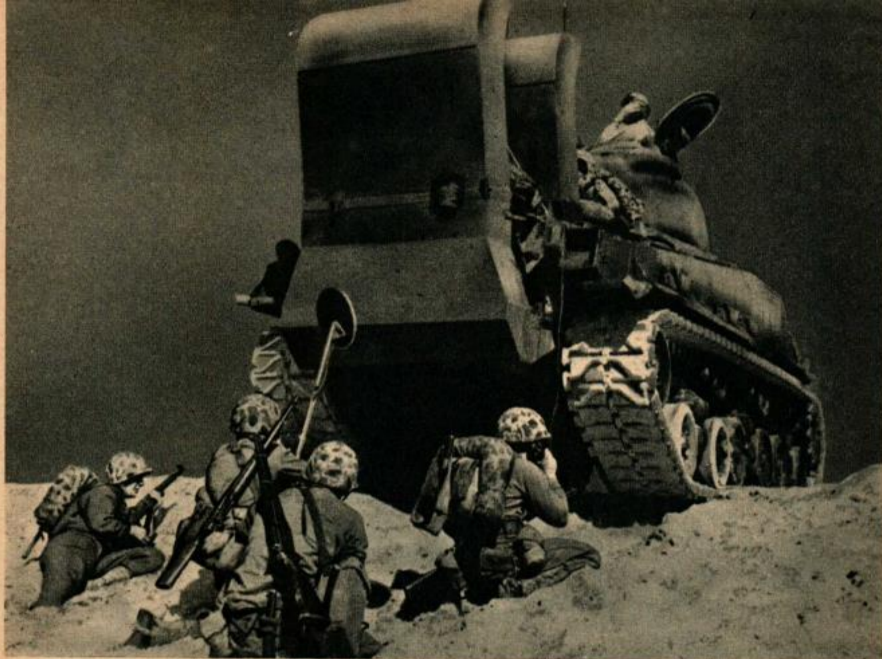
Le gros tank, muni d'appareils «respiratoires» qui lui permettent de passer les fleuves, s'avance sur une plage, épaulé par les troupes terrestres.