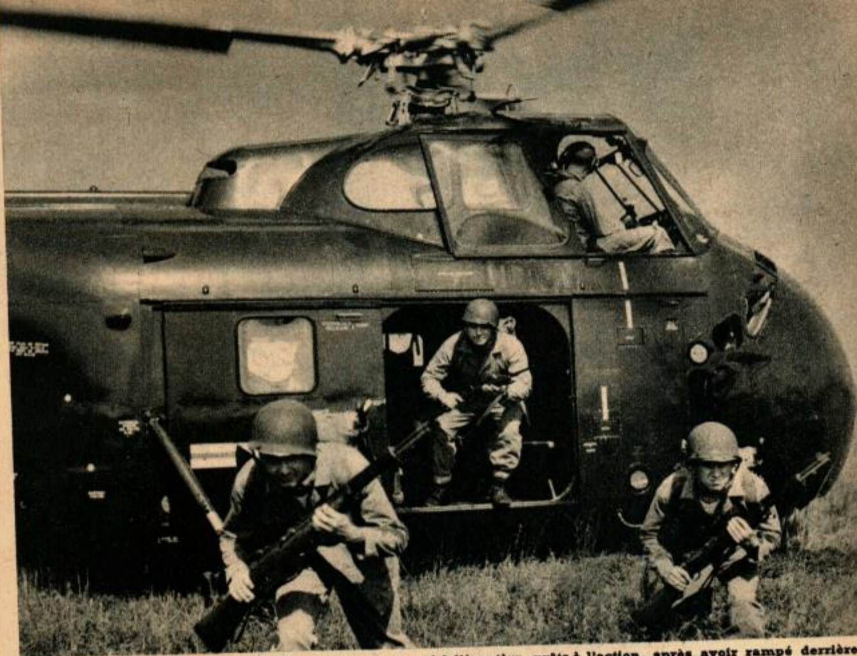
Les « Marines » se précipitent hors de leur nouvel hélicoptère, prêts à l'action, après avoir rampé derrière les lignes « ennemies ».