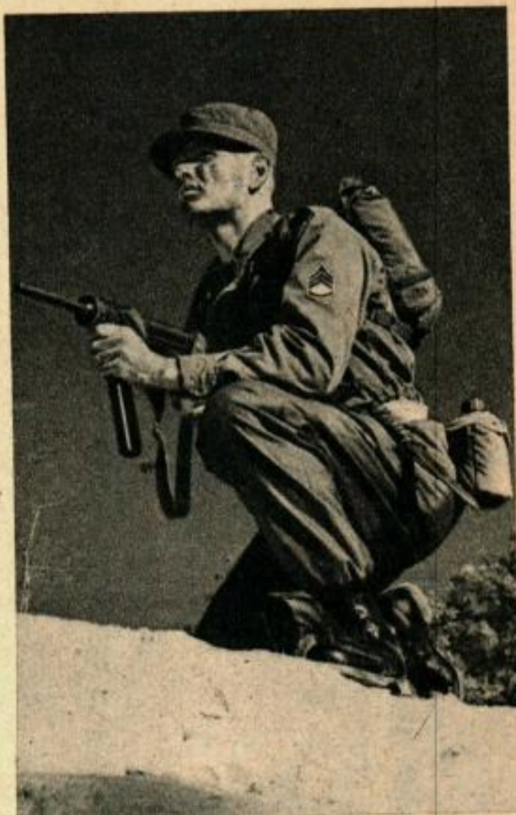
L'éclaireur équipé pour le combat n'est pas lourdement chargé, ce qui lui donne une certaine rapidité de mouvement, mais il emporte tout un arsenal en miniature.

A la fin des 16 semaines d'entraînement de base, la recrue peut être envoyée à l'une des 17 écoles d'entraînement spécial, ou s'engager volontairement pour des missions spéciales, accomplies à l'aide d'un équipement varié où l'on emploie des centaines de