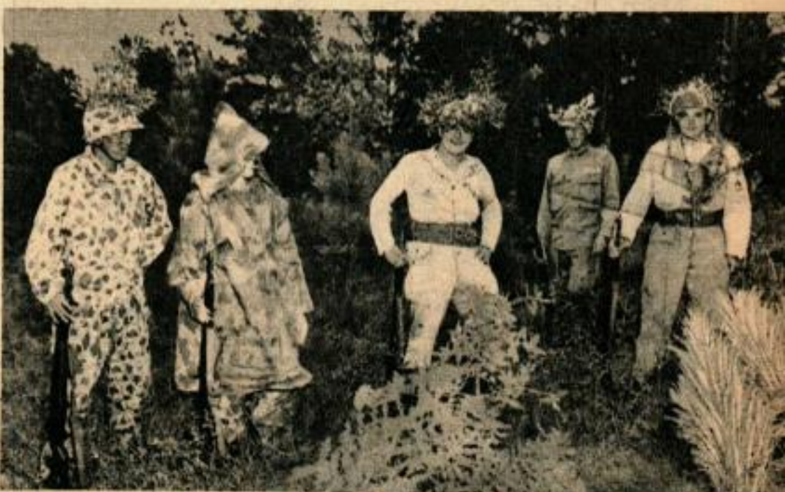
Les éclaireurs bien entraînés présentent cinq types différents de costumes de camouflage. L'éclaireur, lorsqu'il a fini les cours, est capable de disparaître dans la campagne. Ci-dessous, une recrue apprend à se servir d'un lance-flammes pour attaquer un nid de mitrailleuse «ennemi».