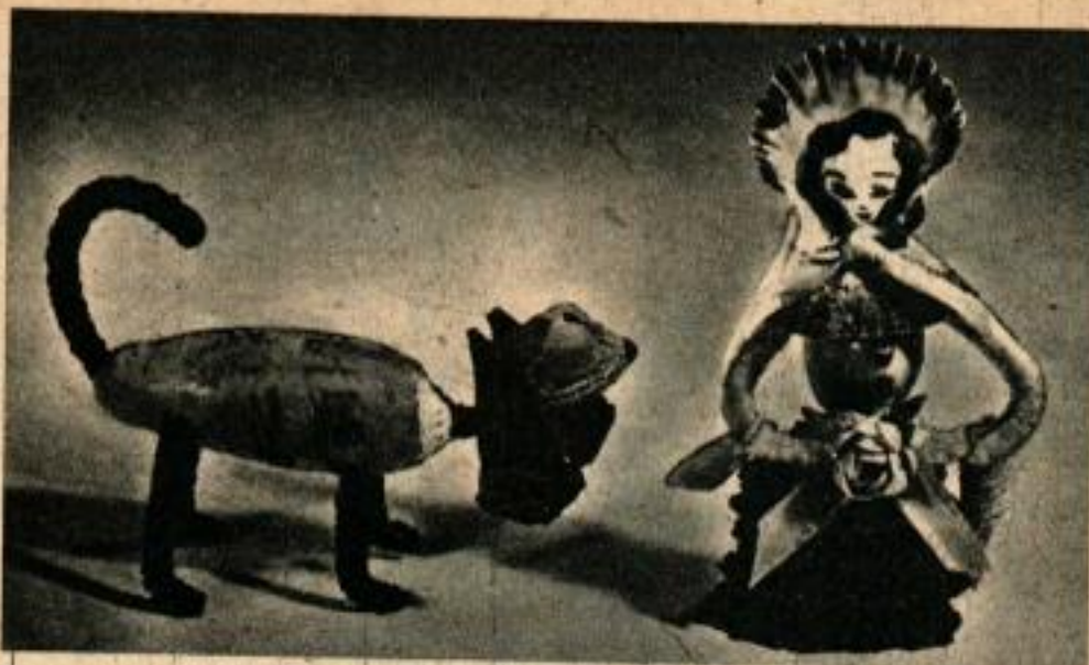
Comme décoration supplémentaire, le chien ci-dessus a des oreilles faites avec des morceaux de pin, et la poupée est faite de cure-pipes, de ruban et de 37 petits coquillages.

Les conques et autres coquilles analogues doivent être meulées pour en arrondir les bords et enlever les pointes aiguës qui pourraient être dangereuses. Beaucoup de coquilles doivent être blanchies ou teintées d'une couleur brillante pour en améliorer l'aspect. Lorsque Hanacek a monté une pièce, et lorsque le ciment a pris, il finit l'ensemble au moyen d'un vernis transparent et colle un morceau de feutre ou de tissu sous le fond.