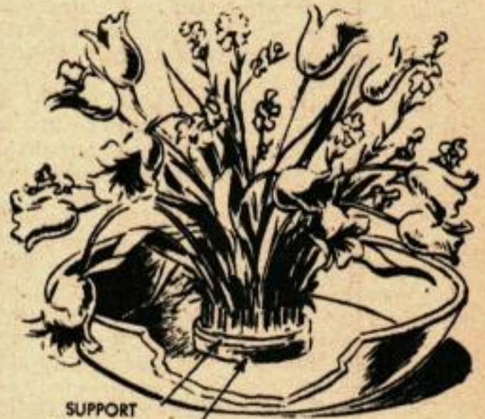
SUPPORT POUR TIGES PÂTE À MODÉLER

Pour éviter de se rôtir les mains lorsqu'on fait griller des viandes en plein air, prendre une assiette de carton pour pique-niques et la placer sur la fourchette ou la broche afin qu'elle agisse comme un écran: l'on a ainsi les mains bien protégées. Ne pas oublier que ces assiettes sont inflammables et qu'il ne faut pas trop les approcher du feu.