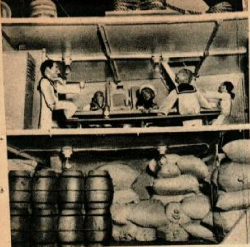
Les marins se reposent dans leur quartier, quand le paquebot navigue. Les tonneaux et les sacs remplissent la cale.

Aussi divertissant qu'un cirque, ce transatlantique en réduction fait rire petits et grands, avec ses passagers et son équipage. Son port d'attache est un grand magasin de Hambourg, ville maritime célèbre.