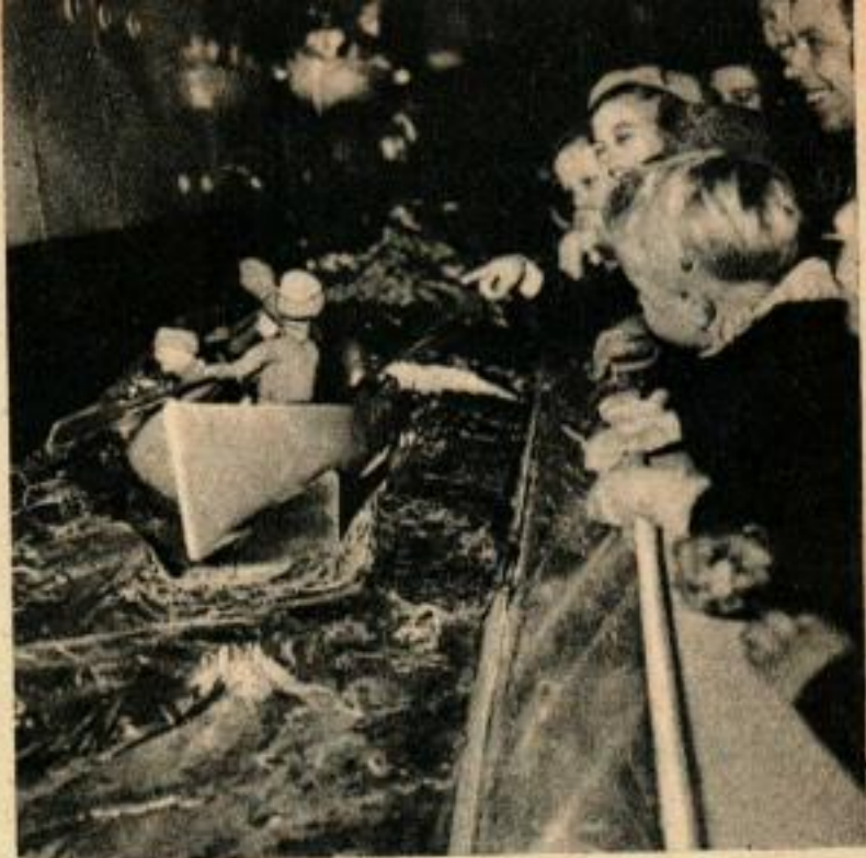
Un passager tombe par-dessus bord et l'équipage court à son secours avec des canots. Les vagues sont en étain.

C'est une réduction de l'« Alsterhaus », qui jauge 20 000 tonnes. Ses flancs sont ouverts pour en montrer l'intérieur, avec des personnages en bois qui sont des passagers et des