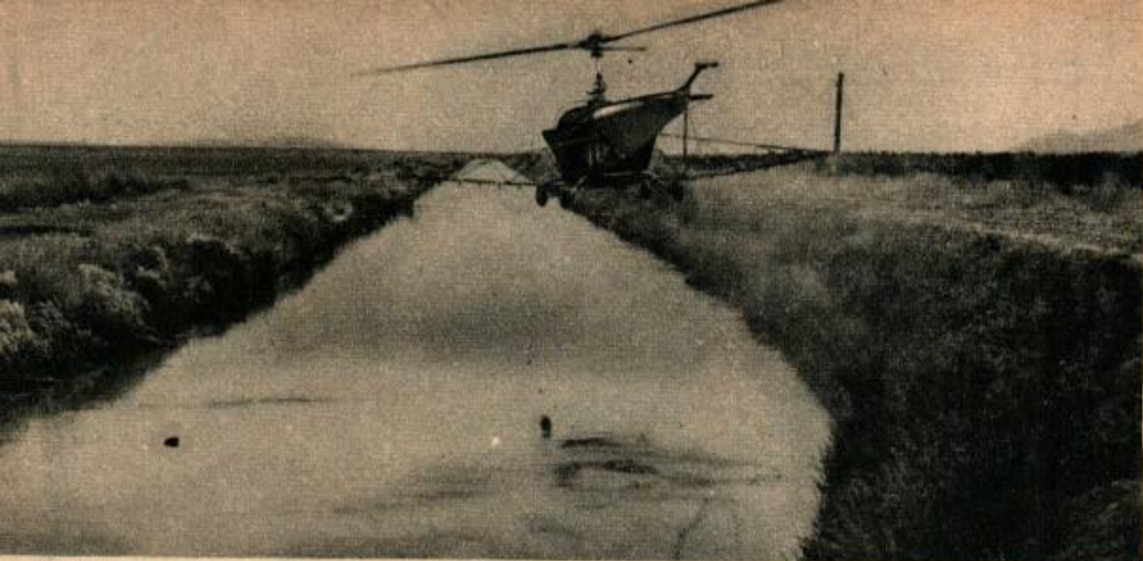
Ce pilote adroit fait une démonstration de pulvérisation en rase-mottes, sur le bord d'un canal.