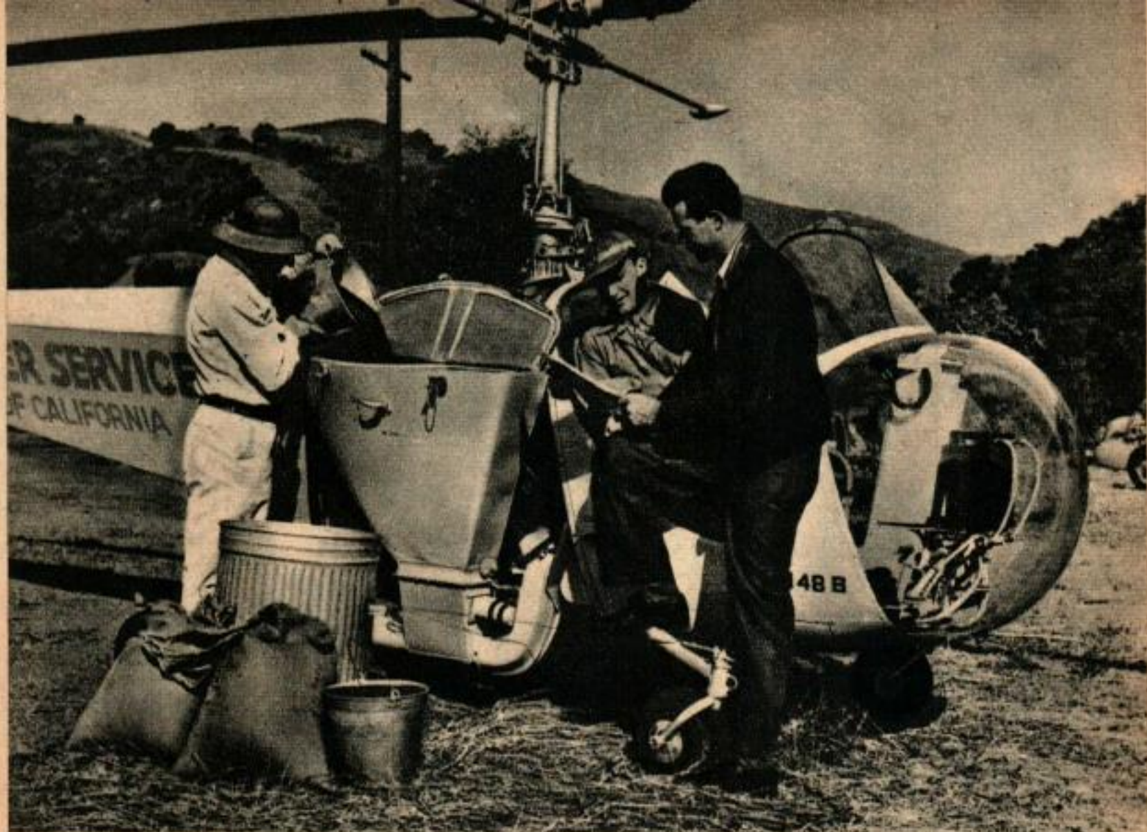
Un hélicoptère muni d'un semoir spécial permet d'ensemencer les prairies.

cachait dans les broussailles; mais, chaque fois qu'il était dans un abri, l'aviateur le forçait à en sortir. Son dernier bond de la journée le conduisit dans le piège.