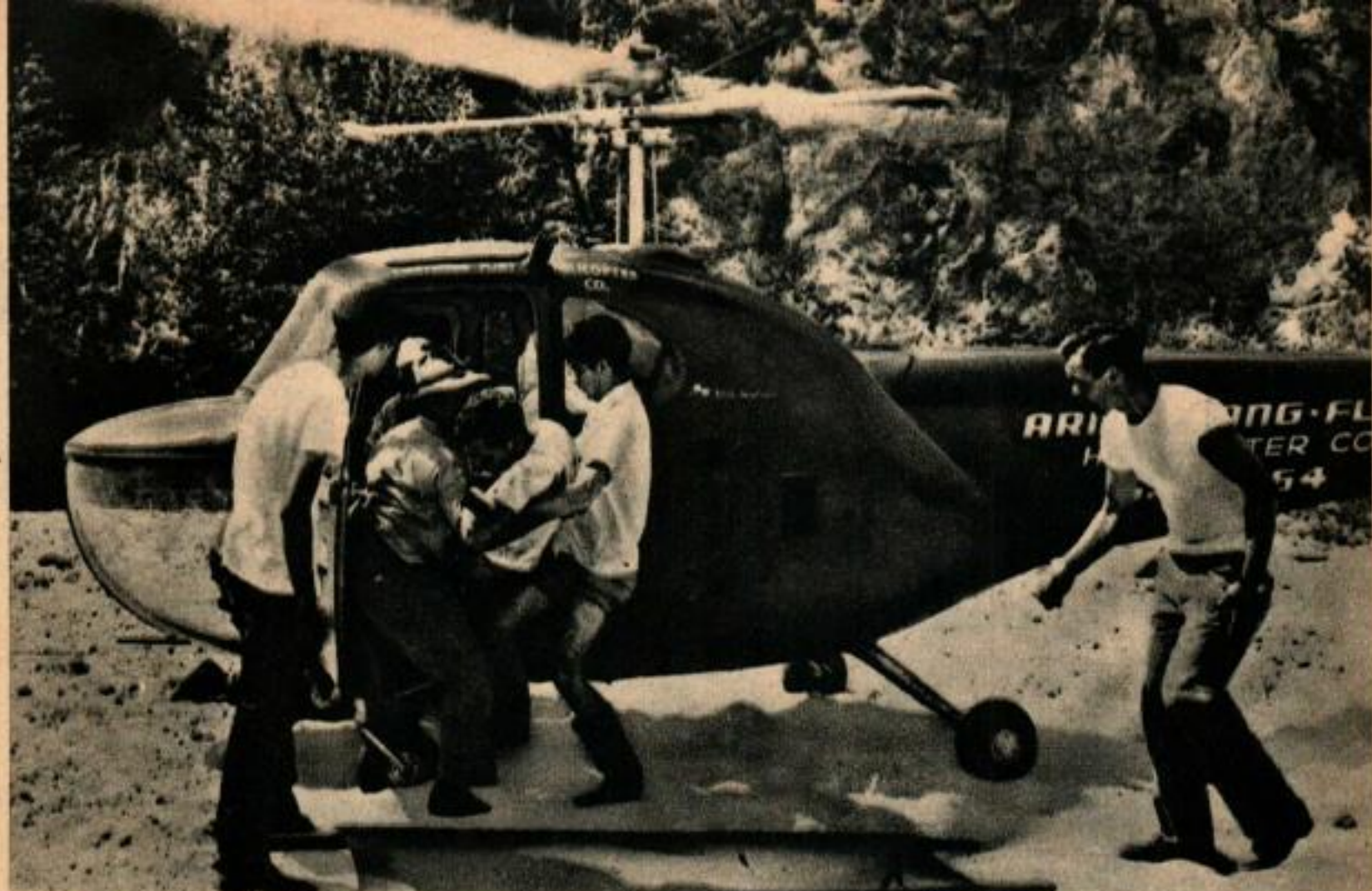
Un pompier blessé est secouru par un hélicoptère, dans un secteur éloigné en Californie. Ci-dessous à droite: le pilote recherche les victimes au sol.

d'avions. Beaucoup d'entre eux ont adopté l'avion simplement parce qu'il leur faut trop longtemps pour couvrir l'étendue de leurs terres. La pulvérisation des cultures au moyen d'avions est entrée dans les mœurs depuis longtemps, mais on fait maintenant des expériences de semences par avion. On obtient ainsi de bons résultats, en particulier pour regarnir les endroits clairsemés.