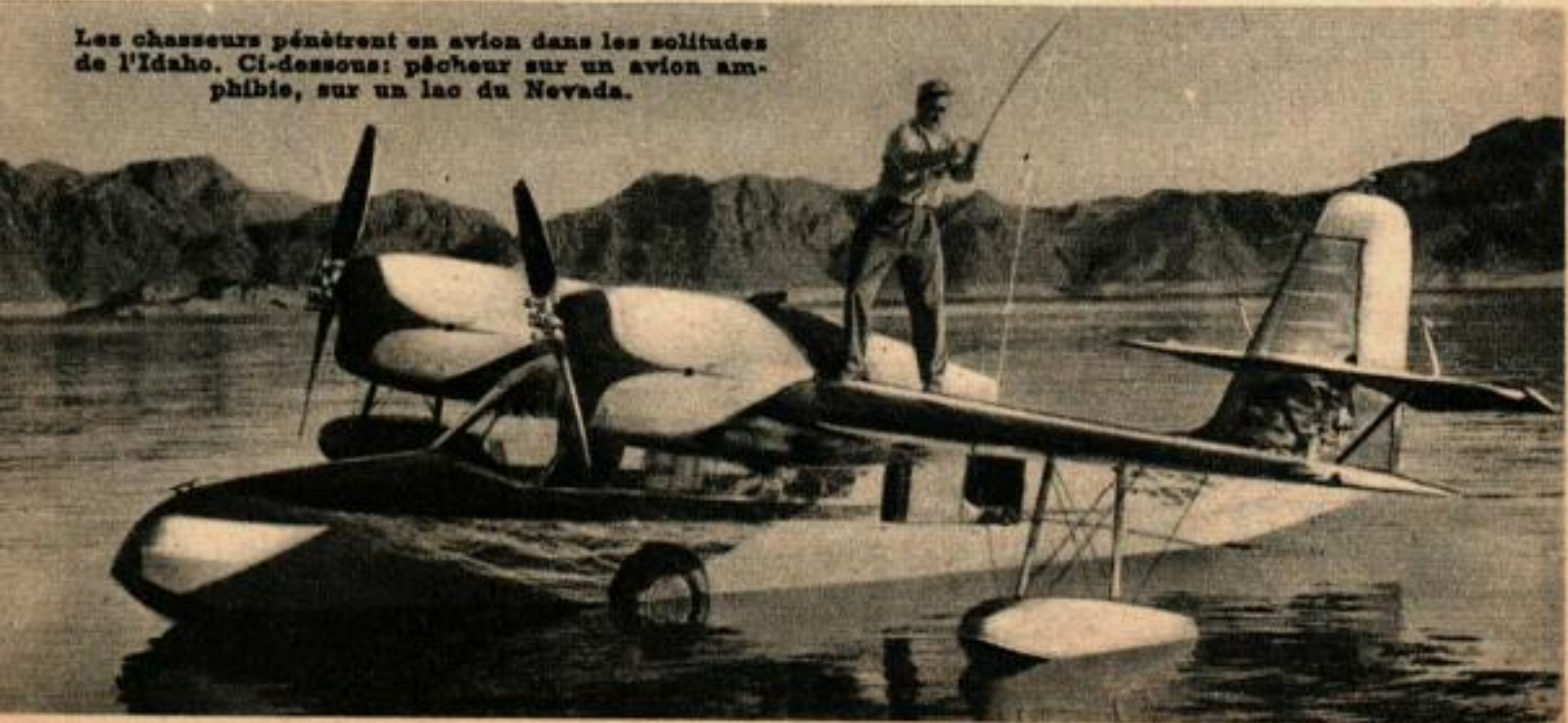
Les chasseurs pénètrent en avion dans les solitudes de l'Idaho. Ci-dessous: pêcheur sur un avion amphibie, sur un lac du Nevada.