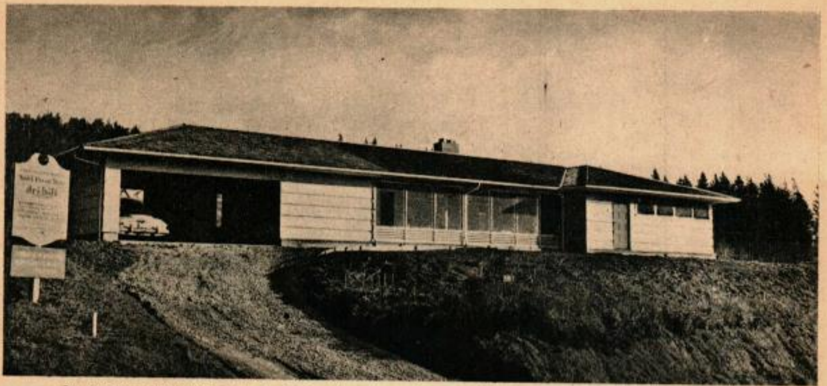
La maison, spacieuse, aux lignes hardies et modernes, prête pour la dernière couche de peinture.