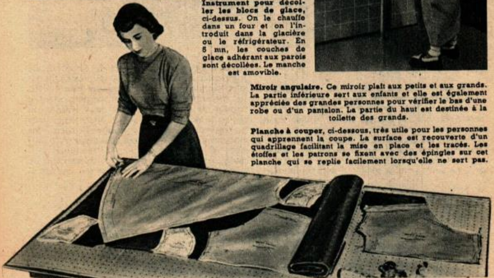
Planche à couper, ci-dessous, très utile pour les personnes qui apprennent la coupe. La surface est recouverte d'un quadrillage facilitant la mise en place et les tracés. Les étoffes et les patrons se fixent avec des épingles sur cette planche qui se replie facilement lorsqu'elle ne sert pas.

Bobineur servant à transformer en 2 mn un écheveau en pelote. L'opération se fait en tournant une manivelle.