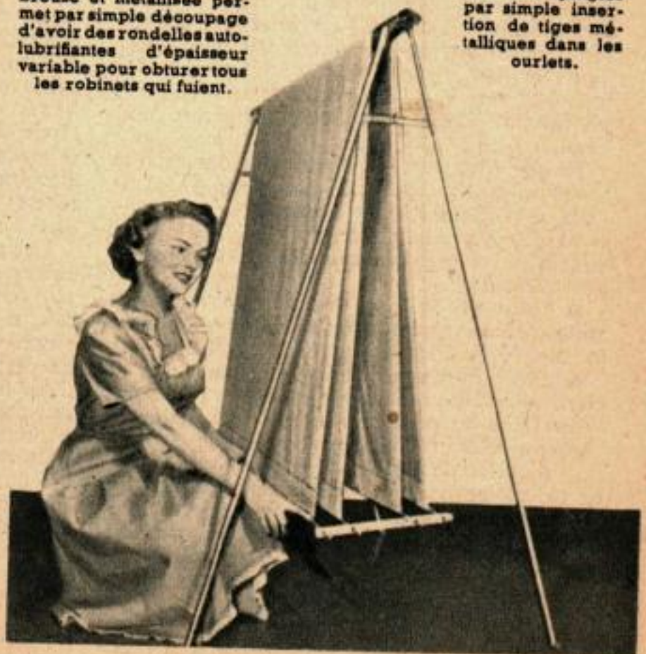
↓ Tendeur pour rideaux fonctionnant sans épingles par simple insertion de tiges métalliques dans les ourlets.