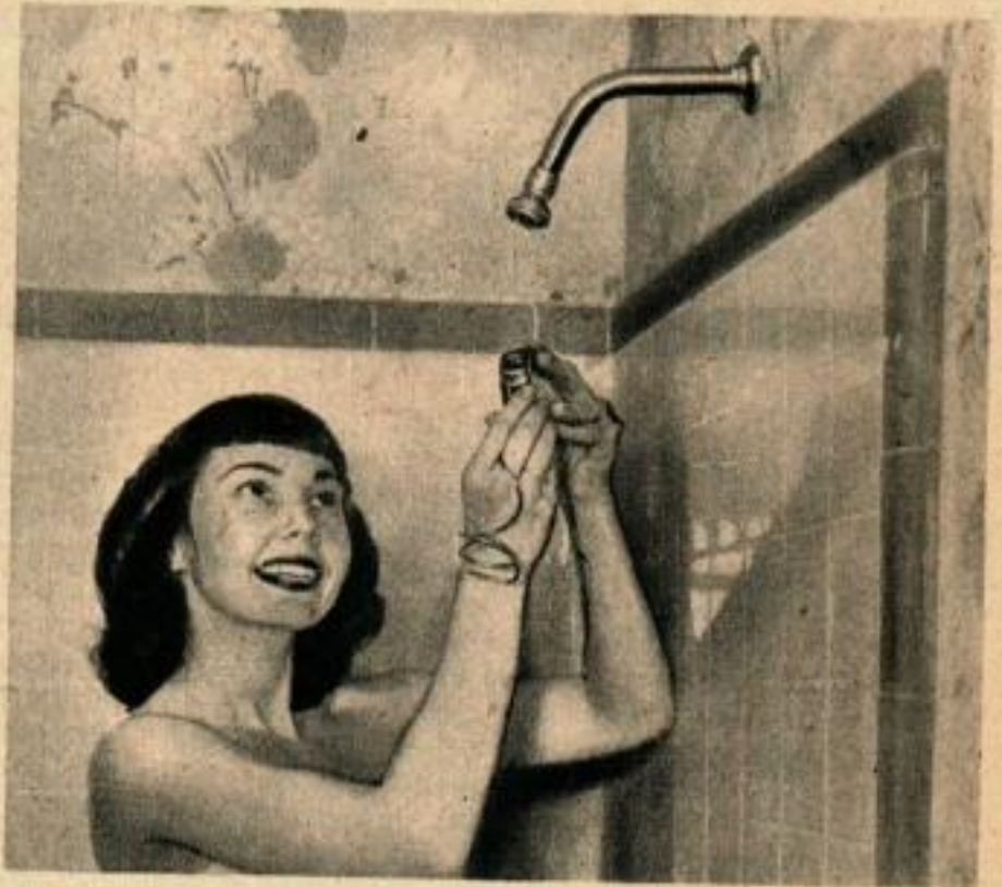
↑ Rondelles à épaisseur variable au choix du client. Cette matière fibreuse et métallisée permet par simple découpage d'avoir des rondelles auto-lubrifiantes d'épaisseur variable pour obturer tous les robinets qui fuient.