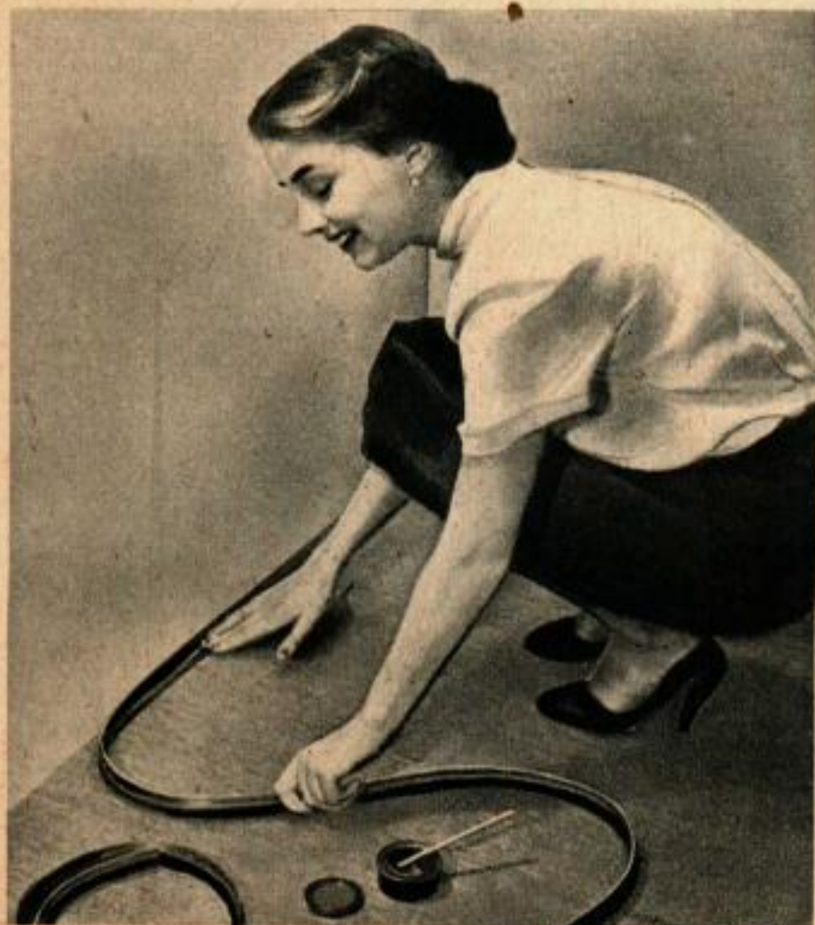
Moulure en caoutchouc se pliant facilement à toutes les formes de parquets droits ou ronds. On la fait tenir par de la colle pour la pose des linoléums.