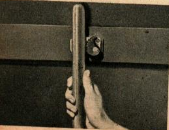
Support à came pour balais. Le poids des manches suffit pour les bloquer dans les mâchoires de caoutchouc de l'appareil.