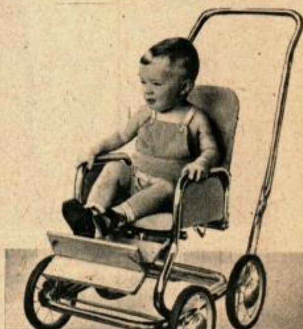
Meuble à tout faire pour bébés. Il se compose de 3 pièces principales que l'on adapte à différents cas tels que: chaise élevée, chariot, table ou chaise roulante.