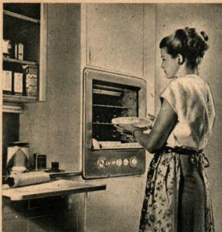
Four électrique placé au niveau des yeux, ce qui en rend l'emploi très commode, on le fixe dans le mur et il est indépendant du fourneau.