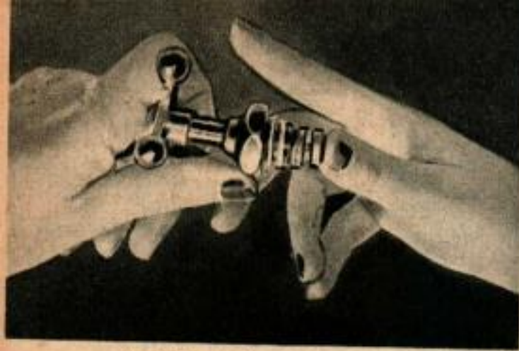
Rondelle facile à mettre, en métal Monel pour robinets. Elle dure éternellement.