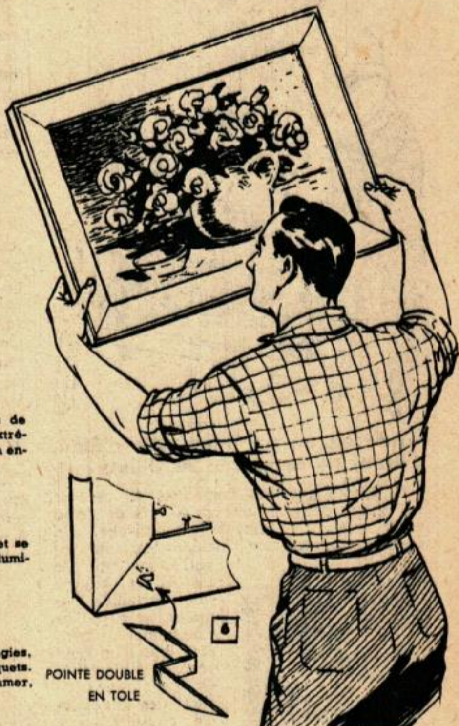
POINTE DOUBLE EN TOLE

Pour allumer à coup sûr les mèches neuves de bougies, les plonger dans l'essence ou du liquide pour briquets. Ne pas attendre trop longtemps avant de les allumer, car l'évaporation est rapide.