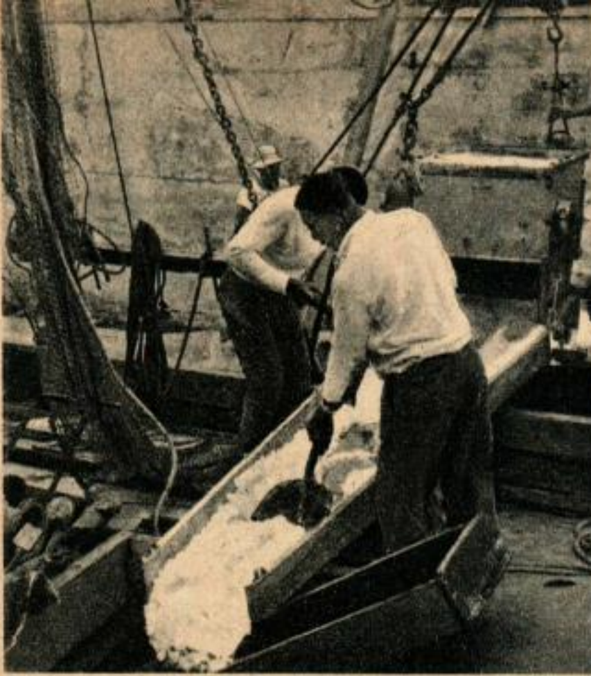
A Key West, la manutention de la glace pilée est un gros travail. Ici, on voit le chargement de cette glace dans la cale du bateau de pêche.