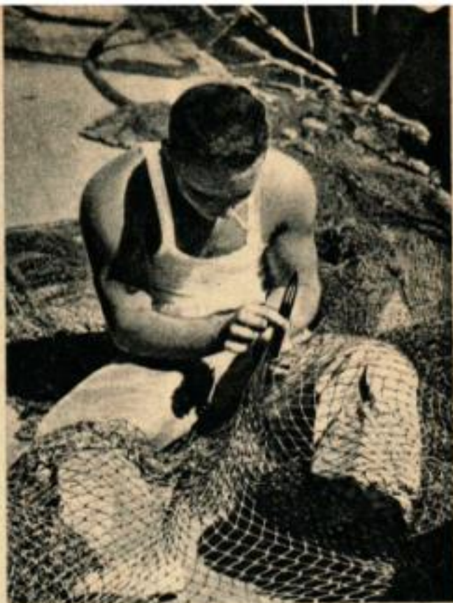
Les récifs de corail des Dry Tortugas endommagent sans arrêt les chaluts. Entre deux voyages, on répare les mailles déchirées.

La région tout entière est réputée pour sa traltrise, surtout au voisinage des Dry Tortugas. L'eau est relativement peu profonde en certains endroits et un vent modéré suffit pour soulever l'eau à une grande hauteur. Avec un vent un peu fort, on a vite fait de couler comme le prouvent les nombreuses carcasses de navires que l'on trouve dans ces parages. C'est une des raisons pour lesquelles les chalutiers se serrent les coudes et sont toujours en communications entre eux et avec la terre.