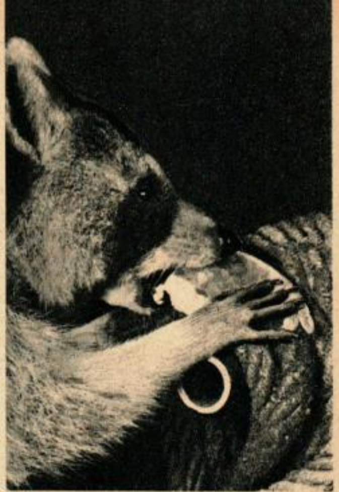
«Salty» le raton fétiche du bord regarde si les crevettes sont propres à la consommation.

Très peu de temps après la bonne nouvelle, 200 chalutiers étaient au travail sur les lieux, chaque jour, on en voyait venir du Nord. Les patrons étaient tellement pressés d'atteindre le banc que certains s'échouèrent dans l'Inland Waterway et durent être remorqués par les bateaux de l'Armée.