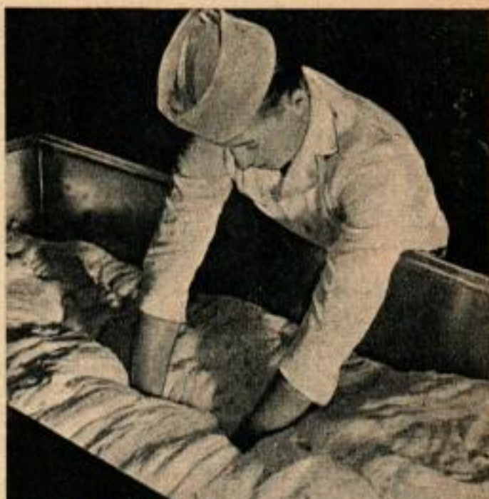
A gauche, la pâte malaxée est versée dans une auge de 225 kg. A droite, on pratique dans la masse en fermentation des canaux d'aération.