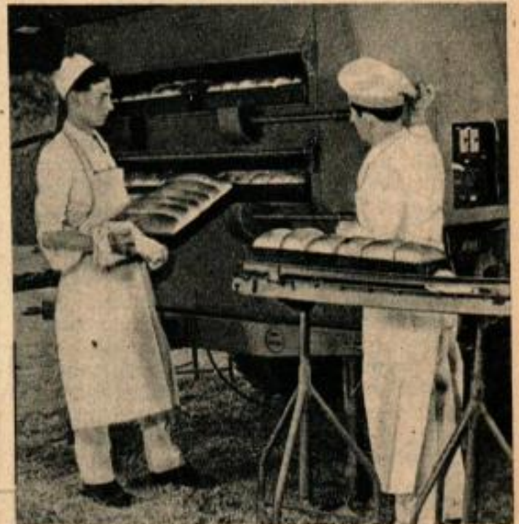
Ci-dessus, les plateaux chargés de pains cuits sont posés sur des convoyeurs qui les amènent aux magasins où ils restent pendant 2 heures pour refroidir. Ci-dessous, camion boulanger et remorque contenant le matériel de malaxage et de moulage des pains.