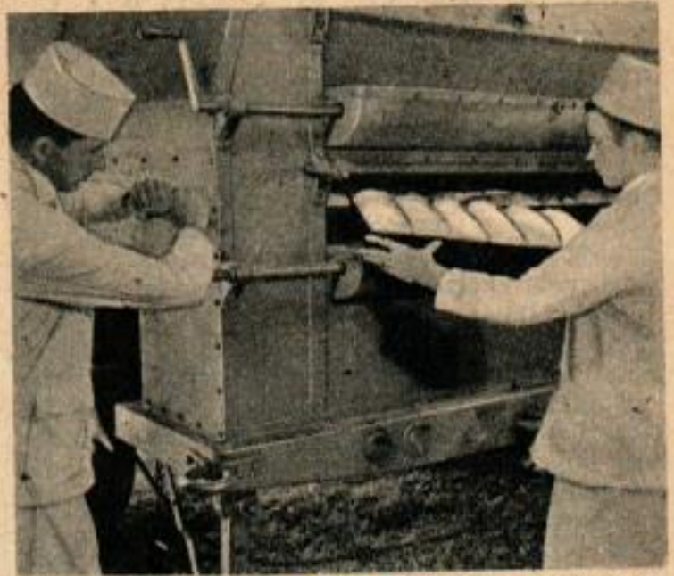
Ci-dessus, dès que la pâte a atteint la consistance voulue, la cuisson se fait pendant 30 minutes, dans le four que l'on voit sur la photo.