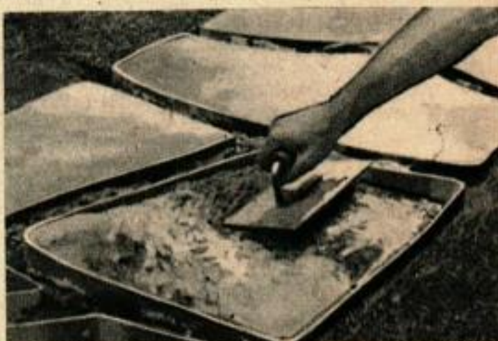
4. Remplir de mortier, bien tasser et niveler avec un chevron. Lisser à la truelle.