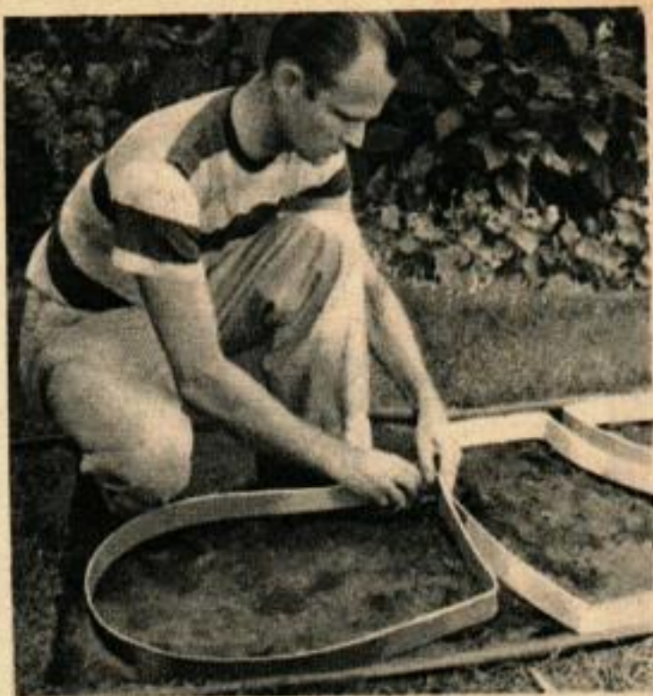
2. Les bandes de feuilard servant de moules sont pliées à la main en suivant des formes irrégulières, mais pas trop étroites afin qu'on puisse y marcher commodément. Attacher les extrémités avec du fil de fer. Mettre les moules à 5 cm les uns des autres.