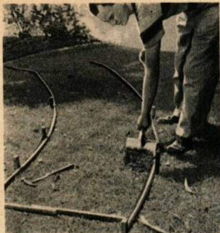
1. Un tuyau d'arrosage est utilisé pour marquer sur le sol le tracé de l'allée dallée. Le fixer par des piquets et enlever le gazon qui servira à remplir les intervalles entre les dalles.