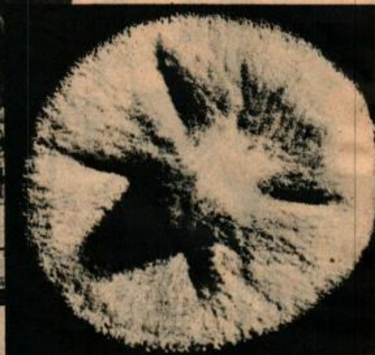
La chance a placé un germe de moisissure dans une culture de bactéries examinée plus tard par le Docteur Fleming. La moisissure représentée ci-dessus empêche le développement des bactéries. Ceci amena la découverte de ce produit étonnant: la pénicilline.

Son morceau de verre « sandwich » avec un liant transparent entre deux plaques de verre fut le précurseur du verre de sécurité qui, depuis son apparition en 1926, a sauvé un nombre incalculable de vies.