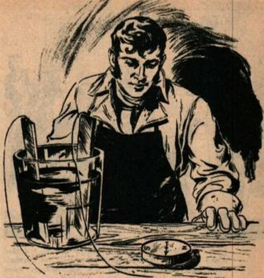
Oersted plaça accidentellement une boussole près d'un fil relié à une batterie. L'aiguille ne se comporta pas comme celle d'une boussole normale. La découverte du principe qui se cachait derrière cette particularité conduisit à la construction des génératrices géantes.

Un jour, en 1839, alors qu'il était assis devant un poêle, il s'amusait songeusement