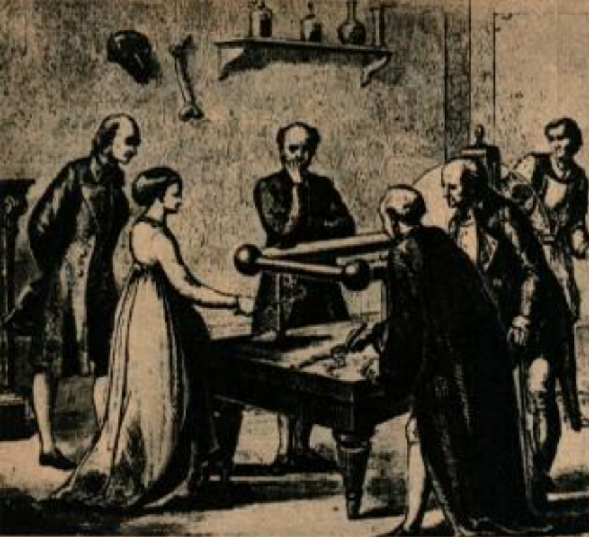
La femme de Galvani avait remarqué que les muscles d'une grenouille tressaillaient quand elle les touchait avec un scalpel qui avait été en contact avec une machine électrique. Ceci conduisit à la batterie galvanique.

avec un morceau de caoutchouc traité au soufre, quand celui-ci lui échappa des mains et tomba sur le métal chaud. Quand il examina à nouveau l'échantillon, il s'aperçut que le caoutchouc était devenu dur et compact et que son adhésivité avait disparu. C'était la solution qu'il cherchait et l'accident le guida vers des recherches qui ont donné le procédé de vulcanisation.