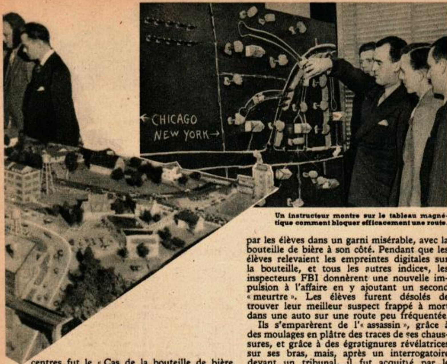
Un instructeur montre sur le tableau magnétique comment bloquer efficacement une route.

centres fut le « Cas de la bouteille de bière tachée de sang », monté par des agents de Philadelphie dans une ville de Pennsylvanie. En plus des agents du FBI, intervenaient dans cette affaire un juge, un huissier, un commissaire de police, quelques industriels, un professeur de droit et une femme agent de la police de Philadelphie.