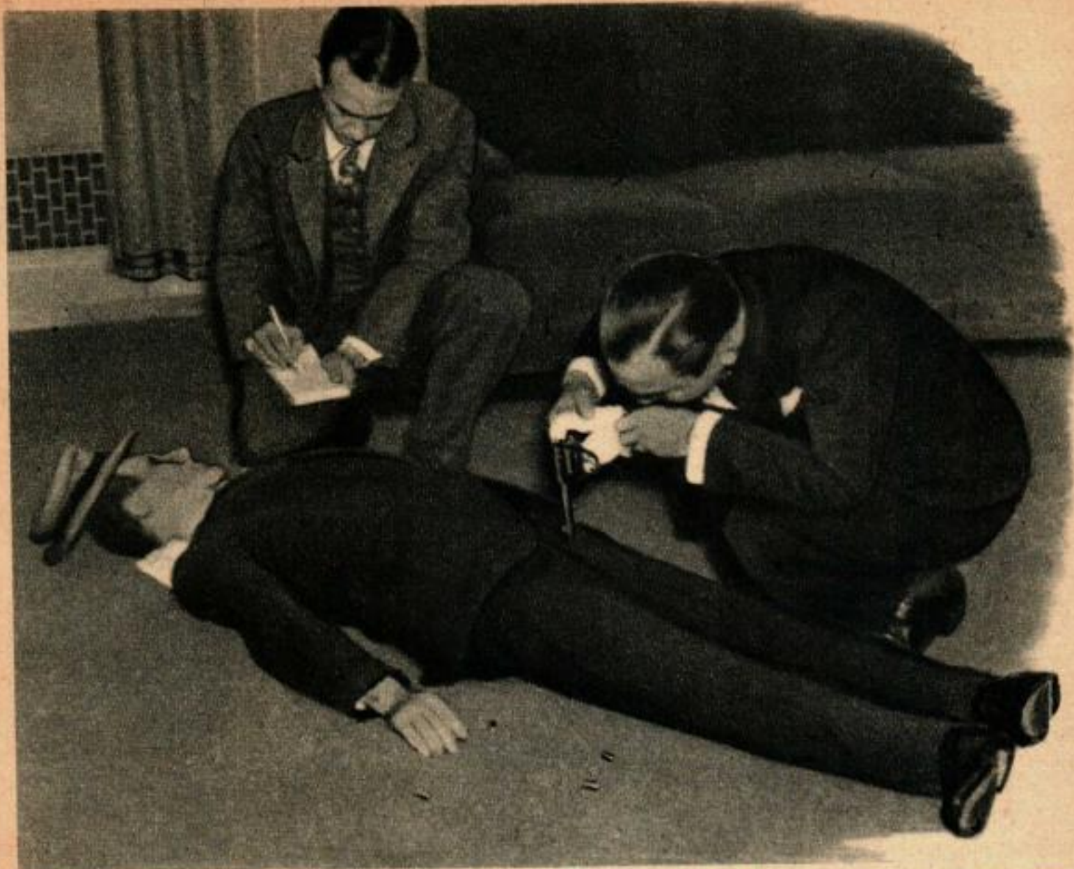
Ce mannequin a été assassiné des centaines de fois pour permettre au FBI d'enseigner comment relever correctement les indices.

des écoles ambulantes les moins ordinaires du monde. Dans ces écoles, il n'est pas question de « jeter le livre à la tête des élèves ». Le livre est jeté par-dessus bord. Il y a des cours, naturellement, mais il n'y a que le minimum absolu.