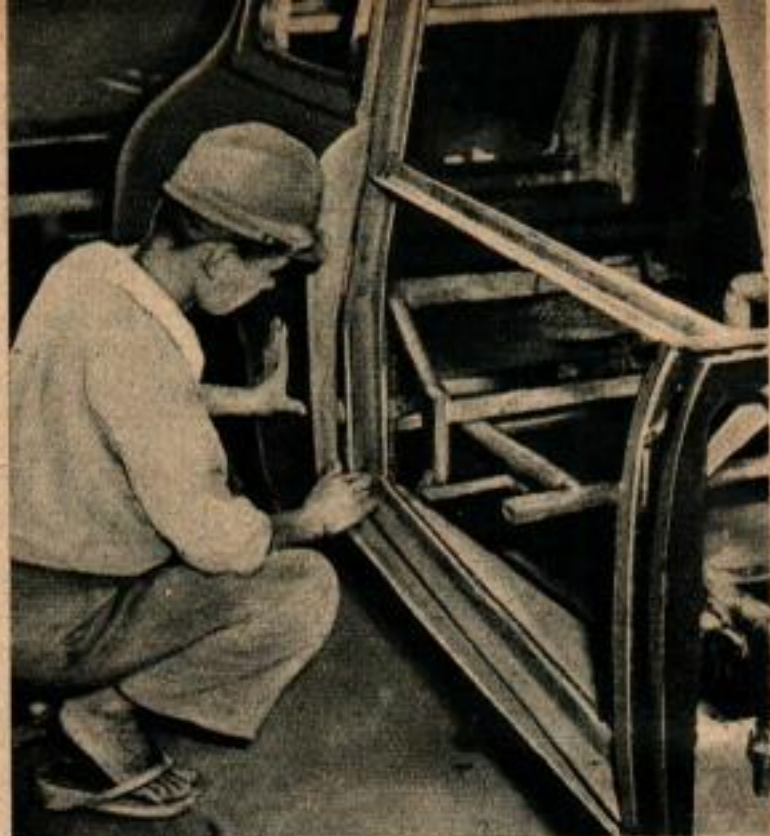
Dans les ateliers de la Compagnie Tama, tout s'ajuste à la main. Les assemblages se font sur des montages en bois.

La Compagnie des Automobiles de Tokio qui construit ces voitures est une cause de stupeur pour les Américains stationnés à l'Aérodrome de Tachikawa et qui sont allés la visiter. L'usine ne comporte ni pont-roulant, ni presse