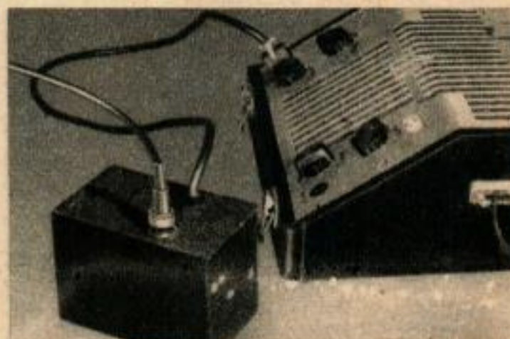
Ci-dessous, un préamplificateur est utile pour augmenter le rayon d'action du microphone.