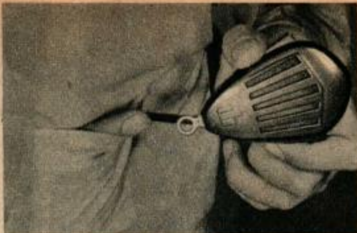
Un petit microphone peut se cacher dans une poche de chemise ou de veste. Percer un trou dans le fond de la poche pour laisser passer le fil du microphone.

Le microphone qui est livré normalement avec les magnétophones est construit pour être employé par une personne qui parle dedans, mais il peut en général donner de bons résultats. Cependant, le véritable instrument pour ces sortes d'enregistrements est le microphone non-directionnel qui recueille bien les sons quelle que soit l'orientation dans laquelle ils sont émis. Naturellement, il faut tenir compte des distances et des bruits de fond lorsqu'on envisage cette utilisation du magnétophone et du microphone. Le microphone semi-directionnel, que l'on voit ici dans certaines des photos, est satisfaisant lorsqu'on l'utilise pour recueillir le son venant d'une direction générale assez bien déterminée, ce qui est le cas lorsqu'il s'agit d'un groupe de personne en train de parler. Pour les groupes plus nombreux il faut s'arranger pour que chacun des interlocuteurs ait l'occasion de parler pas trop loin du microphone. Dans le cas d'assemblées nombreuses, il est presque impossible d'enregistrer tout ce qui se dit en même temps. Bien qu'il ne soit pas indispensable, il est bon d'utiliser un préamplificateur qui augmente les possibilités de captage du microphone.