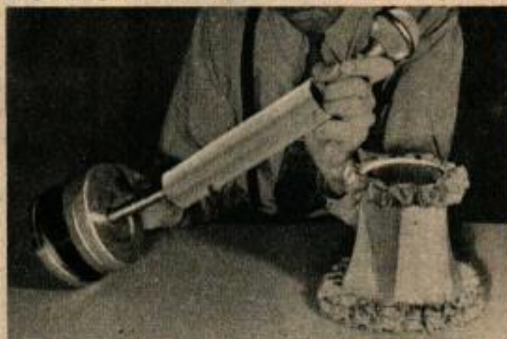
Pour enregistrer les conversations des petits groupes, on transforme le microphone lui-même en lampe postiche.