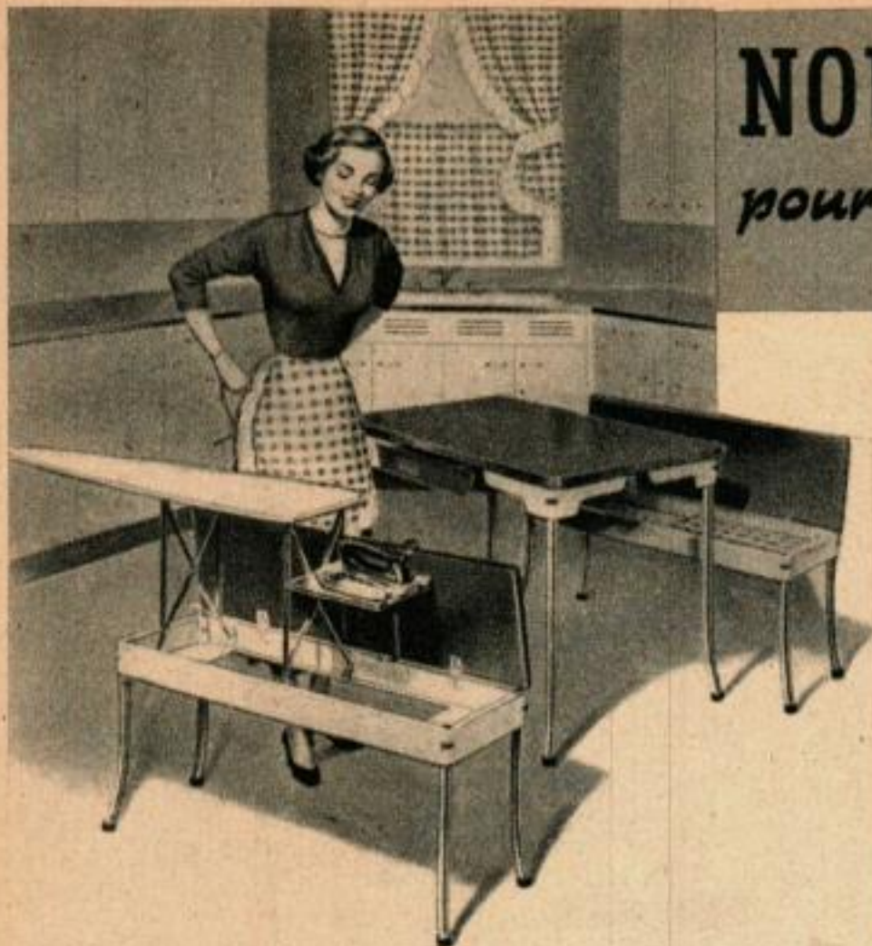
Petite salle à manger à usage multiple constituée par deux bancs et une table. Un banc contient une planche de repassage, l'autre renferme le linge ou les couteaux.