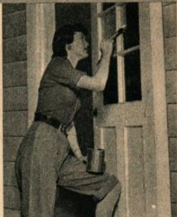
Cette peinture « brouillard » sur les carreaux fait le même effet que le verre dépoli. Elle peut être vaporisée ou passée au pinceau.