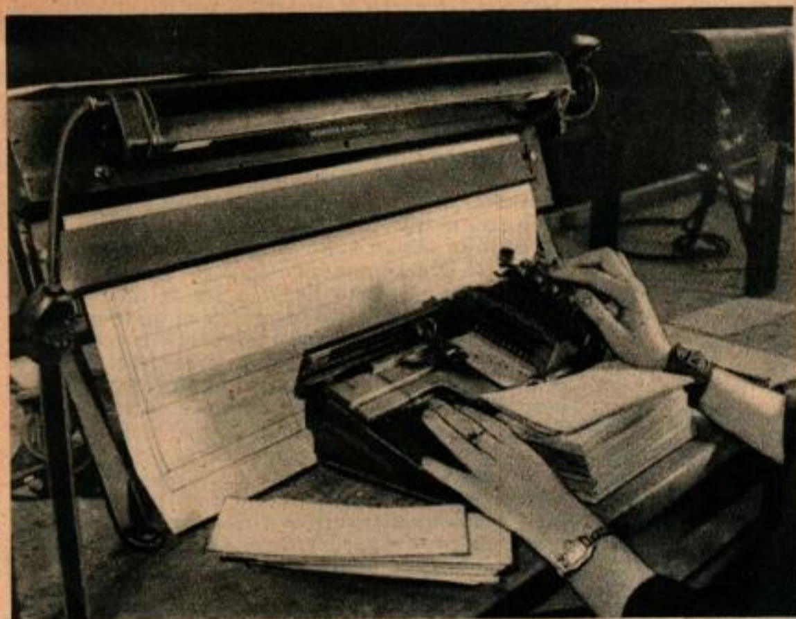
Les renseignements fournis par la feuille de recensement sont transcrits sur des cartes perforées qui sont ensuite groupées par une machine suivant la disposition des perforations. Le dessin représente une femme de recensement qui dut grimper à une cheminée de 20 m de haut pour joindre un ouvrier qui refusait de descendre.