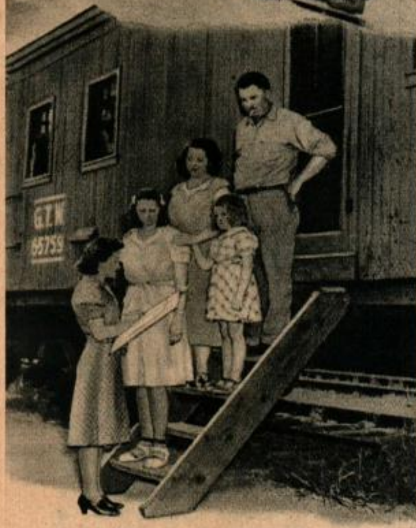
Ci-dessus le recenseur a trouvé la famille d'un cheminot dans un wagon. En haut un autre dénombreur va dans l'Alaska du Nord compter les Esquimaux.