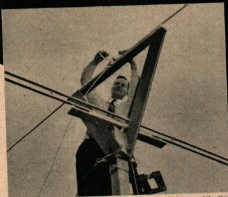
Le croquis montre les queues ionisées laissées par les météorites traversant l'atmosphère. Ces queues réfléchissent les ondes de radio et les renvoient sur la terre. Ci-dessus, on voit les antennes directionnelles qui recueillent les signaux réfléchis.

Lorsqu'un météore entre dans l'atmosphère et qu'il devient incandescent par suite du frottement sur l'air, il abandonne derrière lui une queue formée d'ions gazeux. Cette queue agit comme un miroir qui renvoie vers la terre une partie de l'énergie émise par le poste de radio. L'onde réfléchie est soumise à l'effet Doppler qui introduit une variation de fréquence traduisible en variation de vitesse. Un système de repérage en azimut conjugué avec la radio-caméra indique le chemin suivi par le météore. La durée du parcours et l'intensité de l'onde réfléchie donnent une idée des dimensions de ce dernier. Les signaux ultérieurs provenant des réflexions multiples et qui sont envoyés par la queue gazeuse ionisée alors que le météore a déjà disparu, permettent de connaître à peu près la vitesse et la direction des vents qui règnent dans la haute atmosphère.