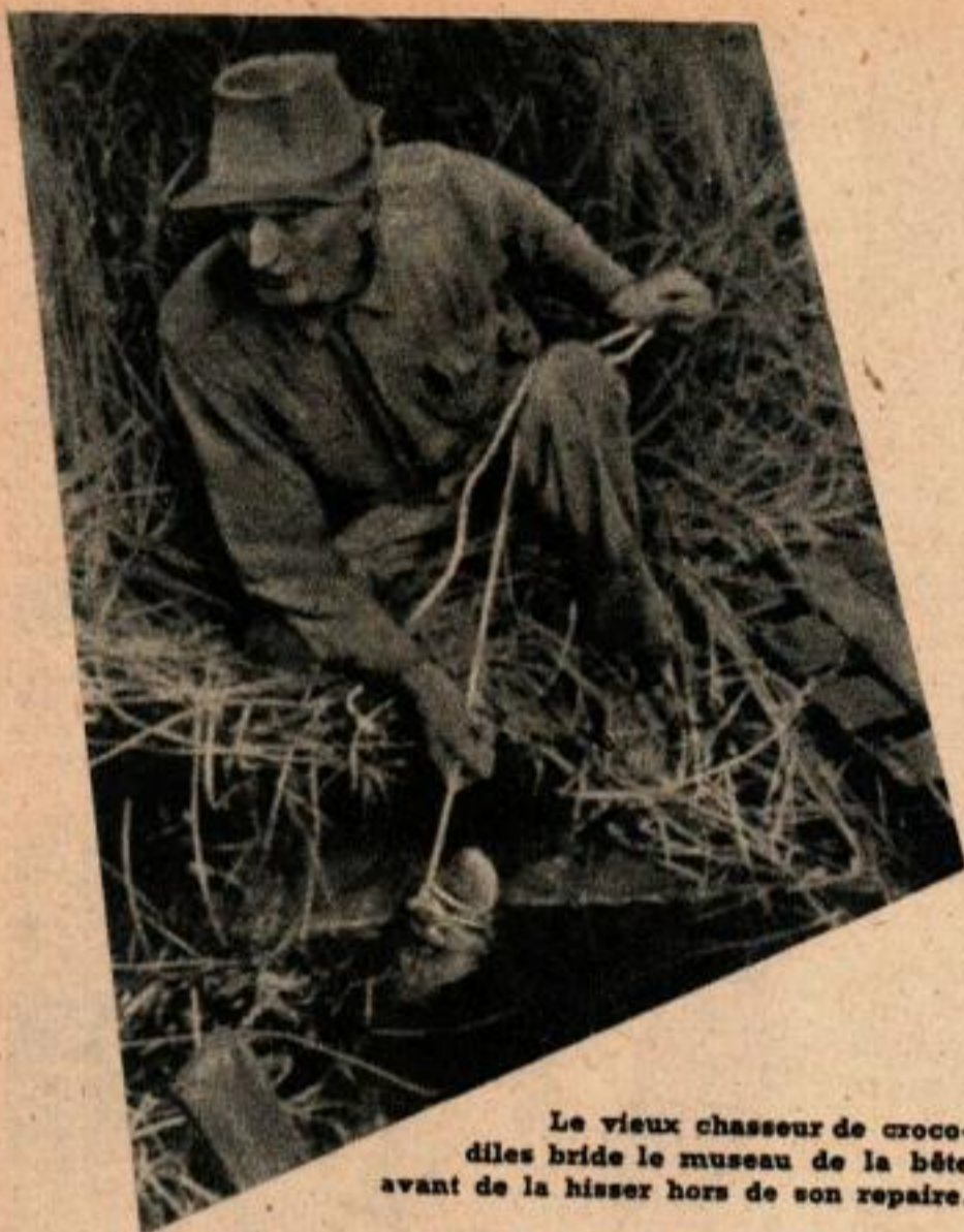
Le vieux chasseur de crocodiles bride le museau de la bête avant de la hisser hors de son repaire.

De son petit bateau, le chasseur repère le crocodile quand il repose