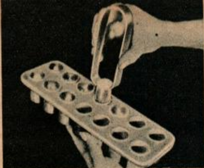
Cubes circulaires. — Il s'agit de « cubes » de glace à l'usage des excursionnistes qui peuvent les mettre dans une bouteille Thermos. Le plateau s'adapte à n'importe quel réfrigérateur.