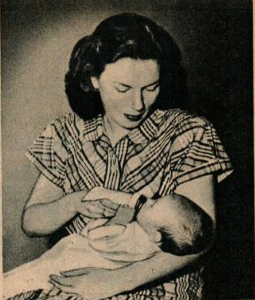
Biberon incassable. — On trouve actuellement dans le commerce un biberon en matière plastique. Ci-dessous on voit les couvercles qui empêchent les poussières de tomber dans les tétines.