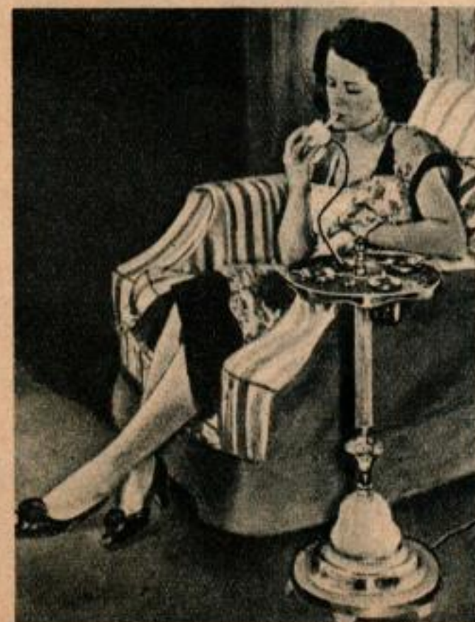
Nécessaire de fumeur. — On voit à gauche ce petit meuble dans lequel un allume-cigarettes électrique fonctionne dès qu'on le soulève. Le pied du meuble est en onyx mince transparent afin de servir de lampe pour la nuit.