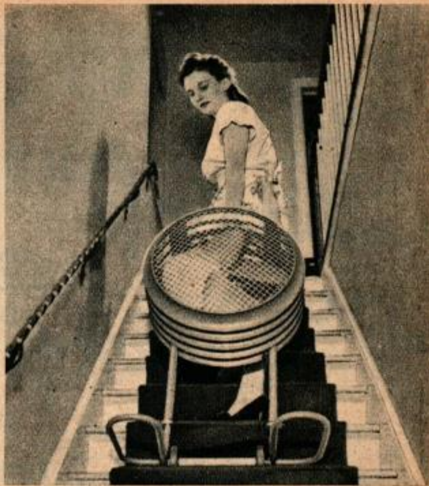
Ventilateur sur roues pouvant être transporté n'importe où dans la maison. Il peut changer l'air des pièces habitées d'une maison normale de 4 à 5 pièces en 2 minutes.