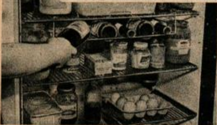
Dispositif pour économiser de la place dans les armoires frigorifiques. Il se suspend aux étagères normales, mais permet d'utiliser une place en général perdue. Il est fait en métal chromé.