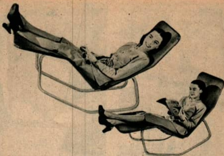
Cette chaise inclinable repose confortablement les jambes pour s'asseoir et lire ou quand elle est inclinée en arrière elle vous permet de vous reposer avec les pieds en l'air. Le tissu qui la recouvre est fixé au châssis en aluminium avec des ressorts.