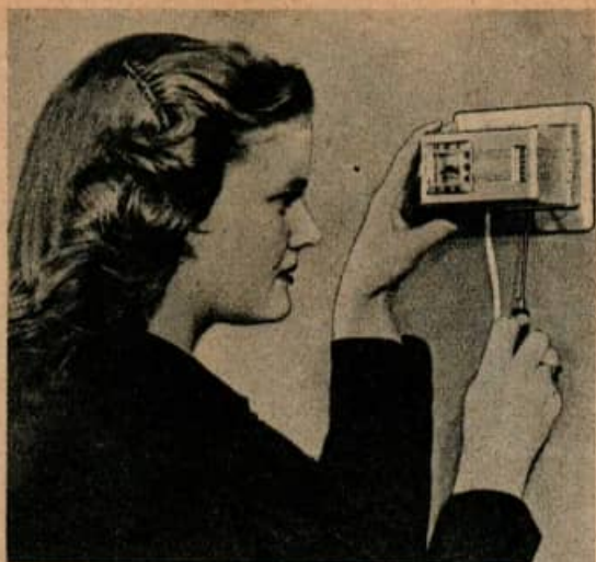
Thermostat pour la nuit et le jour, installé en 5 minutes. Monté sur n'importe quel support de thermostat à main, il utilise le même câblage. Le cordon de la pendule s'accroche à une saillie du mur.