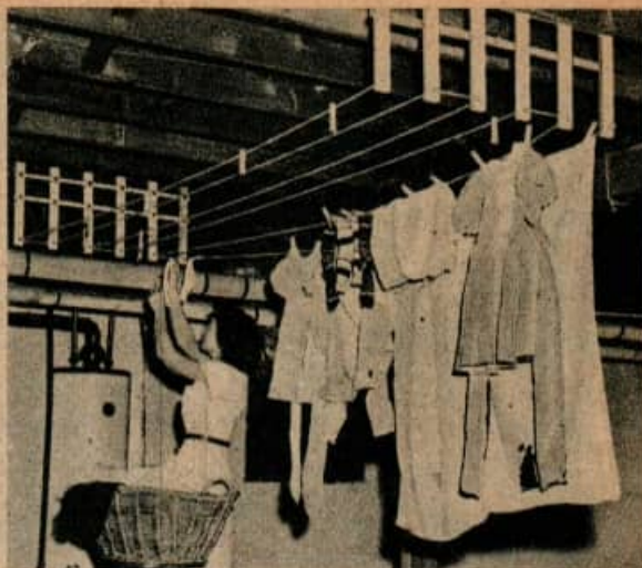
Cet étendoir se plie contre le plafond, hors du passage, quand on ne s'en sert pas (photo ci-dessous). Quand on s'en sert il est tiré à hauteur convenable.