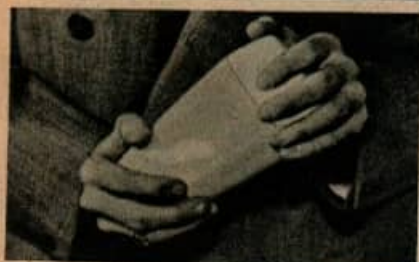
Ce presse-fruit reçoit le jus dans sa base à double usage qui sert de saker quand on utilise le couvercle.