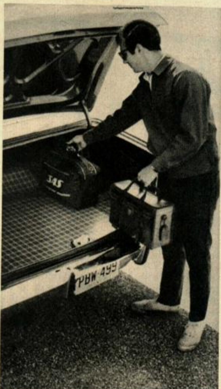
Le niveau relativement bas du plancher de la malle rend son utilisation très pratique.

recevoir, sur option, une boîte de vitesses automatique, des servo-freins, des freins à disques à l'avant, une direction assistée, un différentiel auto-bloquant et la gamme de ses moteurs va de 2789 cm 3 à 5210 cm 3 .