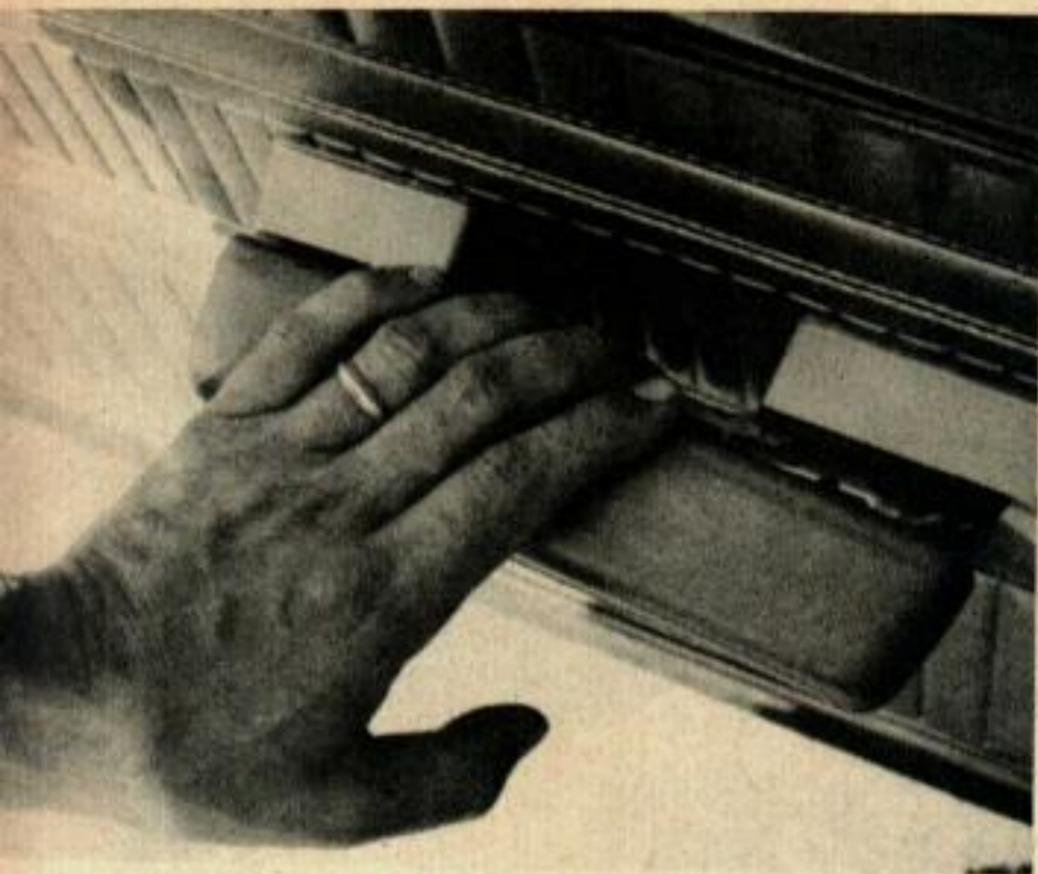
La finition est critiquée par certains utilisateurs. Les poignées intérieures des portières sont les plus discutées.