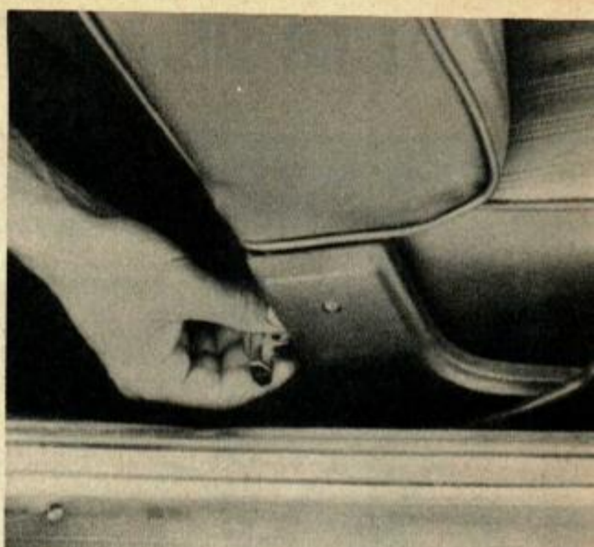
Sur la « deux portes », le verrouillage des sièges avant est situé très près du plancher, ce qui n'est pas apprécié de tous.