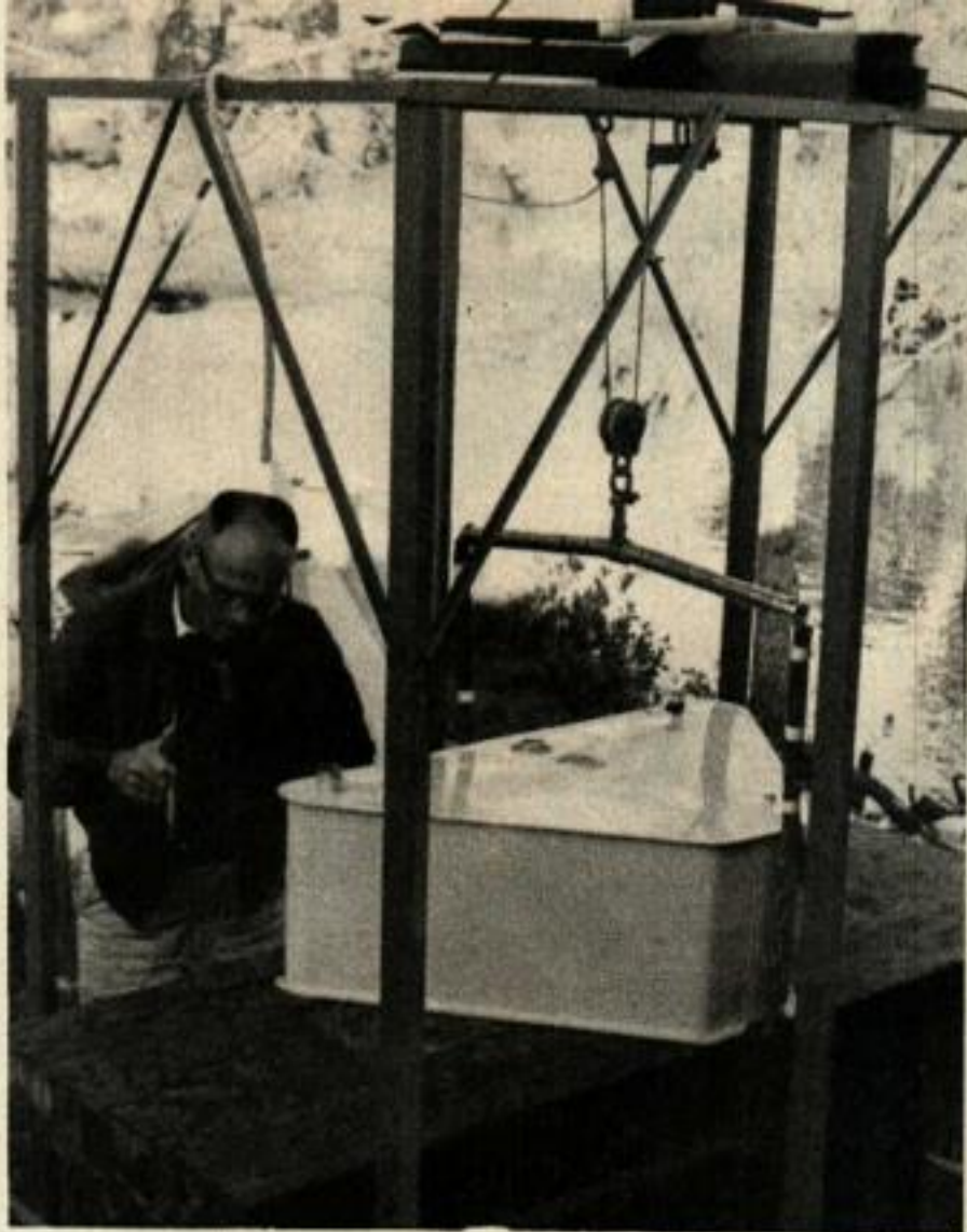
Le test de la chute est positif lorsque le réservoir rempli d'eau a résisté à un choc de 25 G pendant 1000 chutes. Les essais sont très durs, le pilotage met à mal bateau après bateau, de mois en mois.

son estomac était complètement vide, la couleur des hélices avait tenu lieu d'appât pour l'affamé. Mais on a constaté que les requins s'attaquaient parfois à d'autres hélices et qu'ils semblaient particulièrement attirés par celles à échappement central... on ne procède pas autrement pour attraper certains poissons avec une cuiller qui bouge dans le courant de la ligne remontée!