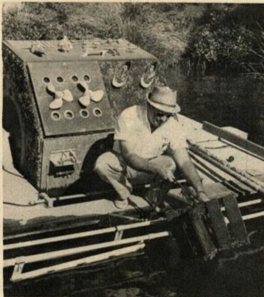
Modification d'un bateau d'aluminium de 4,26 m: on rallonge la barre de direction, on ajoute des coussins et l'on cale le dossier.

te navigation, l'enchaînement de petits incidents menant généralement à l'accident irrémédiable.