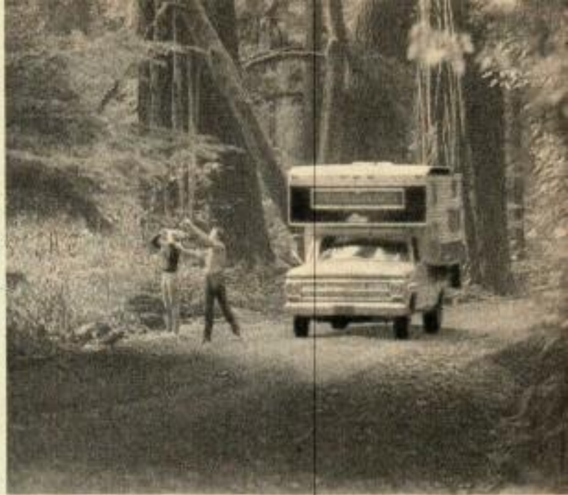
La roulotte semble minuscule à côté des arbres.

Beam et à l'arrière Flex-O-Matic est conçue pour les terrains accidentés. Cette caravane de plus de 3 tonnes était équipée de pneus extra larges de 25 x 42 qui concurrent à sa tenue que d'innombrables nids de poule n'ont pu mettre en défaut. Pas plus qu'elle ne l'avait été sur route par vent fort.