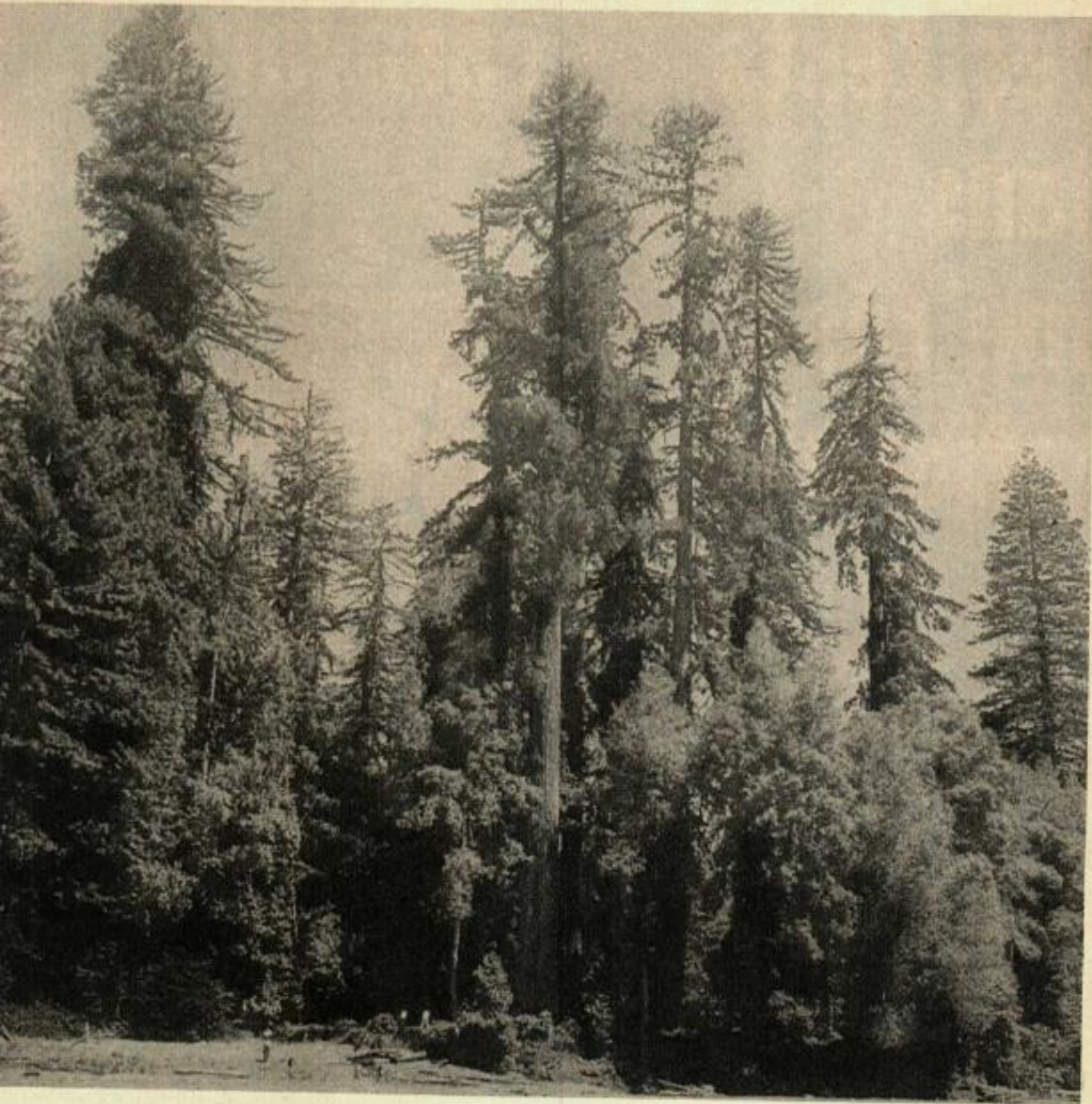
Le plus grand arbre à gauche est un géant de 110 mètres de haut.

C' EST sur un tel parcours, circuit d'essai idéal que fut testée notre caravane Ford 250 Spéciale avec sa cabine El Dorado de 2,75 m. Le lieu choisi fut la partie la plus sauvage du Redwood National Park en Californie, autrefois exploitation de bois durs. Cet immense parc de cèdres centenaires couvre 25.000 ha, il n'est accessible que par des pistes forestières. En Octobre il est parfois aussi humide qu'une forêt équatoriale, il y tombe près de 2,50 m d'eau par an. Baignés d'eau les arbres offrent une lu-