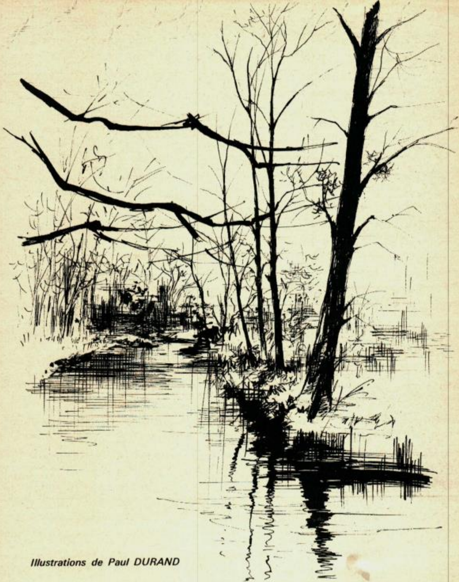
Illustrations de Paul DURAND

La petite rivière a dévalé les dernières pentes de la montagne, traversé les épaisses châtaigneraies, rongé les pentes vertes des prairies. Elle a rencontré la plaine, et soudain assagie, a cherché patiemment son chemin parmi les couches argileuses ou friables. Apaisée, réchauffée, elle a contourné des obstacles qu'elle n'avait plus la force de renverser. Cernant les collines, elle a creusé lentement un lit large et profond, et flâne maintenant entre les grands peupliers, caressant les pieds noueux des vieux saules qui l'ombragent. Tantôt en larges remous calmes, tantôt en rapides courses sur les graviers blonds, elle abrite et nourrit une faune enrichie de multiples espèces.