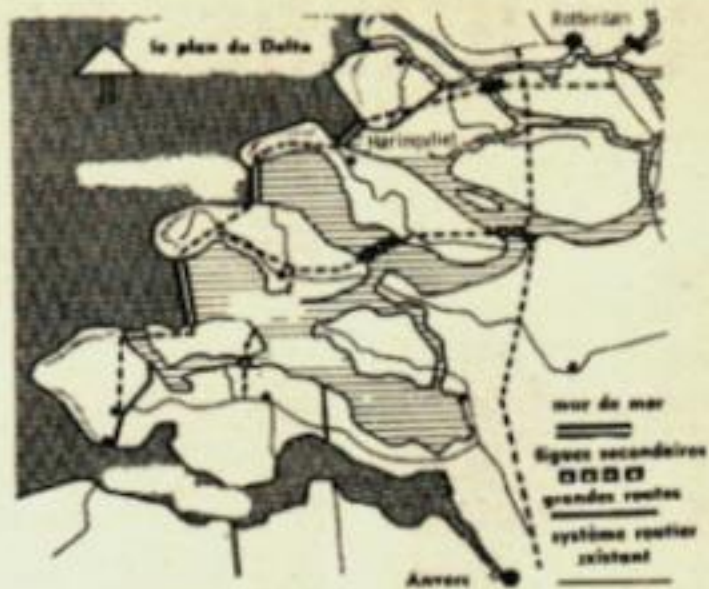
LE PLAN DU DELTA

Ces travaux seront achevés en 1980. La première photo représente le barrage d'Haringvliet avec ses dix-sept fermetures ; il se tiendra face à la mer du Nord (à gauche) et à la rivière Waal Oude Mass (à droite). La seconde photo et le schéma ci-dessus montrent, en coupe, les doubles portes de chaque fermeture.