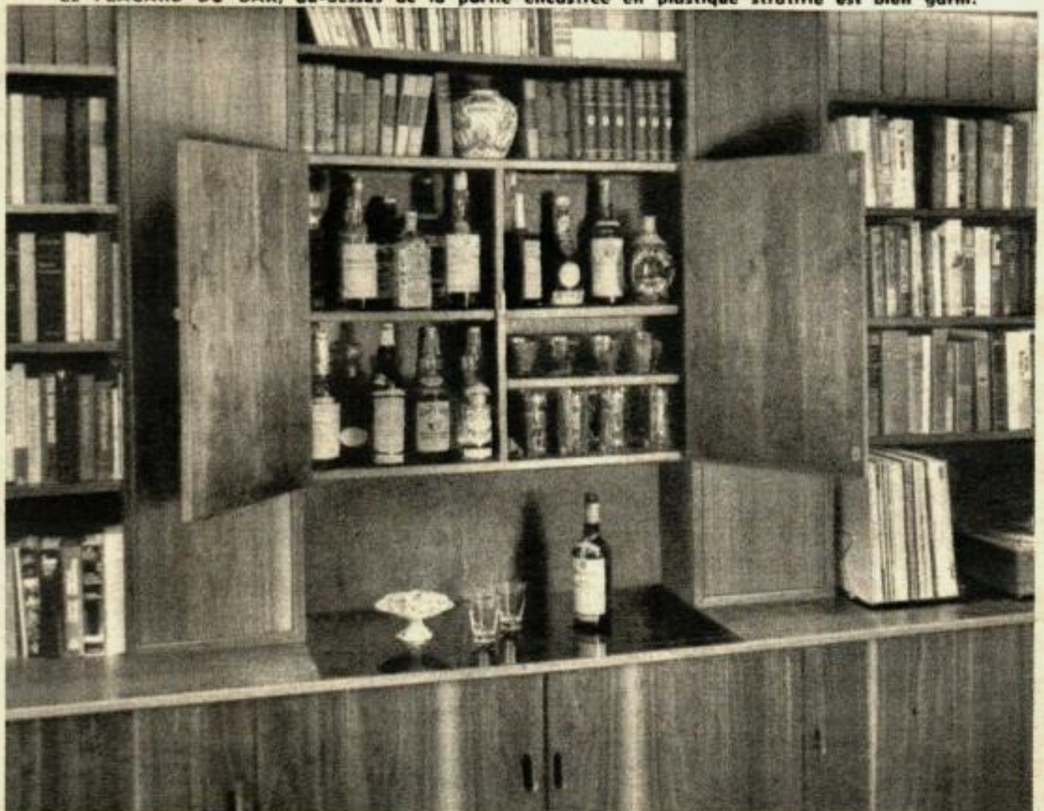
LE PLACARD DU BAR, au-dessus de la partie encastrée en plastique stratifié est bien garni.

Au lieu d'être à l'étroit, nous avons maintenant le confort d'un mur complètement aménagé.