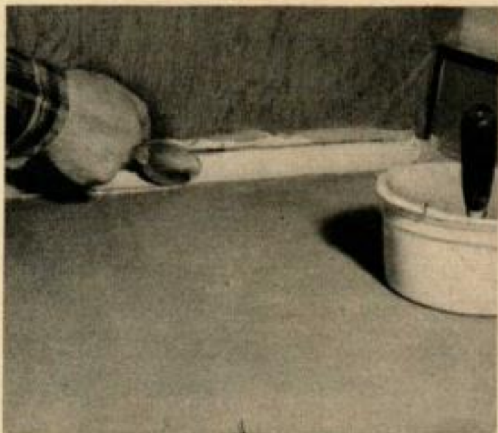
IL EST FACILE DE FORMER des bords profilés. Placer une barre de bois, appliquer le produit de couverture et profiler avec le dos d'une cuillère.

On applique du chatterton là où l'on veut que la nouvelle couche s'arrête.