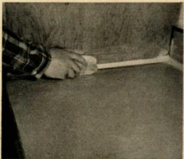
LAISSER LE PRODUIT DE COUVERTURE sécher complètement, puis nettoyer les bords avec un chiffon humide.