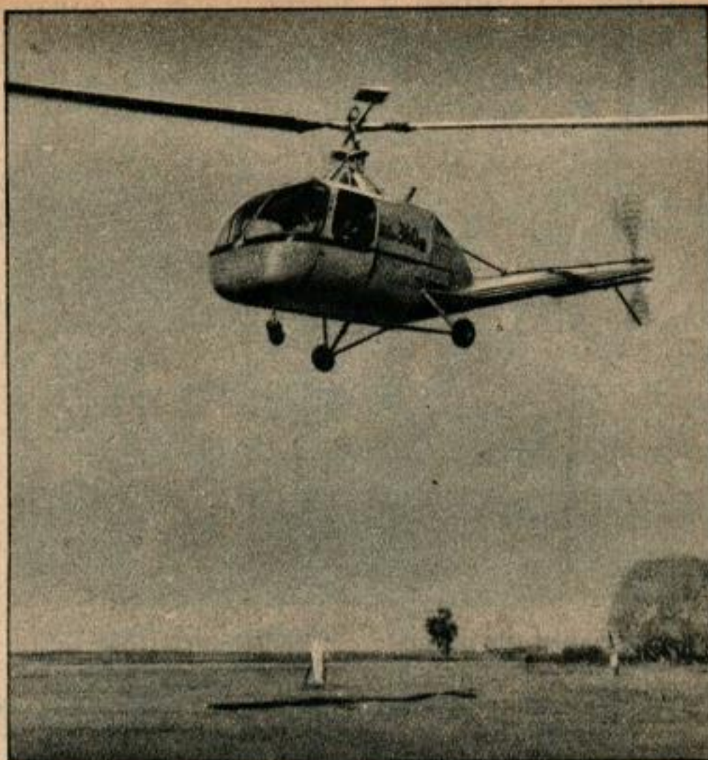
Le 1 er hélicoptère utilisant le système de commande simplifié est le modèle Hiller-360. Une force de 400 g suffit pour actionner le manche à balai. Ci-dessous vue à grande échelle de la tête du rotor. Au lieu des centaines de pièces mobiles que comportaient les anciens systèmes, celui-ci n'en comprend que 7.

Le système permet d'envisager des possibilités d'emploi sur des hélicoptères munis de pales motrices plus importantes que celles que l'on utilise actuellement. On peut l'adapter sur tout modèle d'hélicoptère et il a été initialement incorporé au type à trois places Hiller-360. Cet hélicoptère a un rotor principal à deux pales de 10 m de diamètre et un petit rotor de contre-renversement à l'arrière de la queue et dont le diamètre est de 1,70 m. Il transporte une charge utile importante, inaccoutumée pour ce genre d'appareil, égale au tiers de son poids, lequel, y compris le combustible et le lubrifiant, atteint 960 kg.