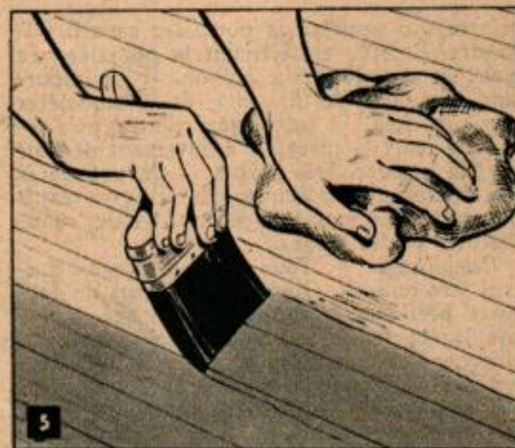
Quelques finisseurs appliquent le produit de remplissage dans le sens du bois comme indiqué; d'autres affirment qu'il vaut mieux l'appliquer au travers du fil, car cette méthode assure une plus grande absorption.