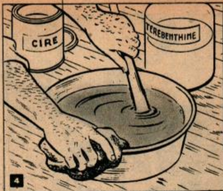
Le produit de remplissage doit être amené avec de la térébenthine à une consistance légère et crémeuse: Remuer soigneusement pour dissoudre tous les morceaux et remuer le mélange à l'occasion pendant son utilisation.

Dépoussiérage. — Quand le plancher aura été complètement poncé et gratté, dépoussiérer tous les rebords et cadres de fenêtres, tous les dormants de portes, les portes et les soubassements. Utiliser pour cela un chiffon de