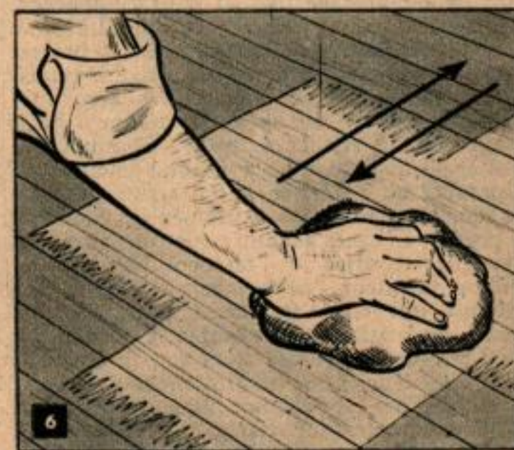
Le produit de remplissage doit toujours être frotté en travers du sens du bois avec un chiffon à gros grain. Doubler plusieurs fois le chiffon pour en faire un tampon souple qui recueillera l'excès de produit.