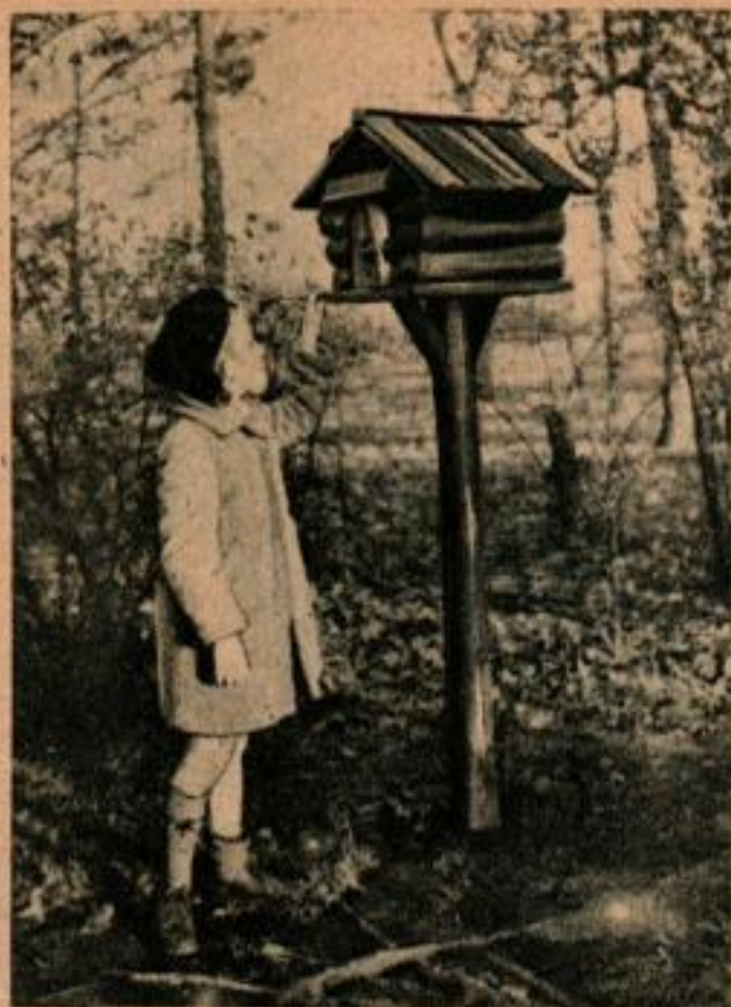
Les gens de la campagne savent à quelle heure le courrier passe chaque jour. Cette boîte aux lettres rustique est un exemple des possibilités photographiques que vous rencontrerez le long des routes de la campagne.