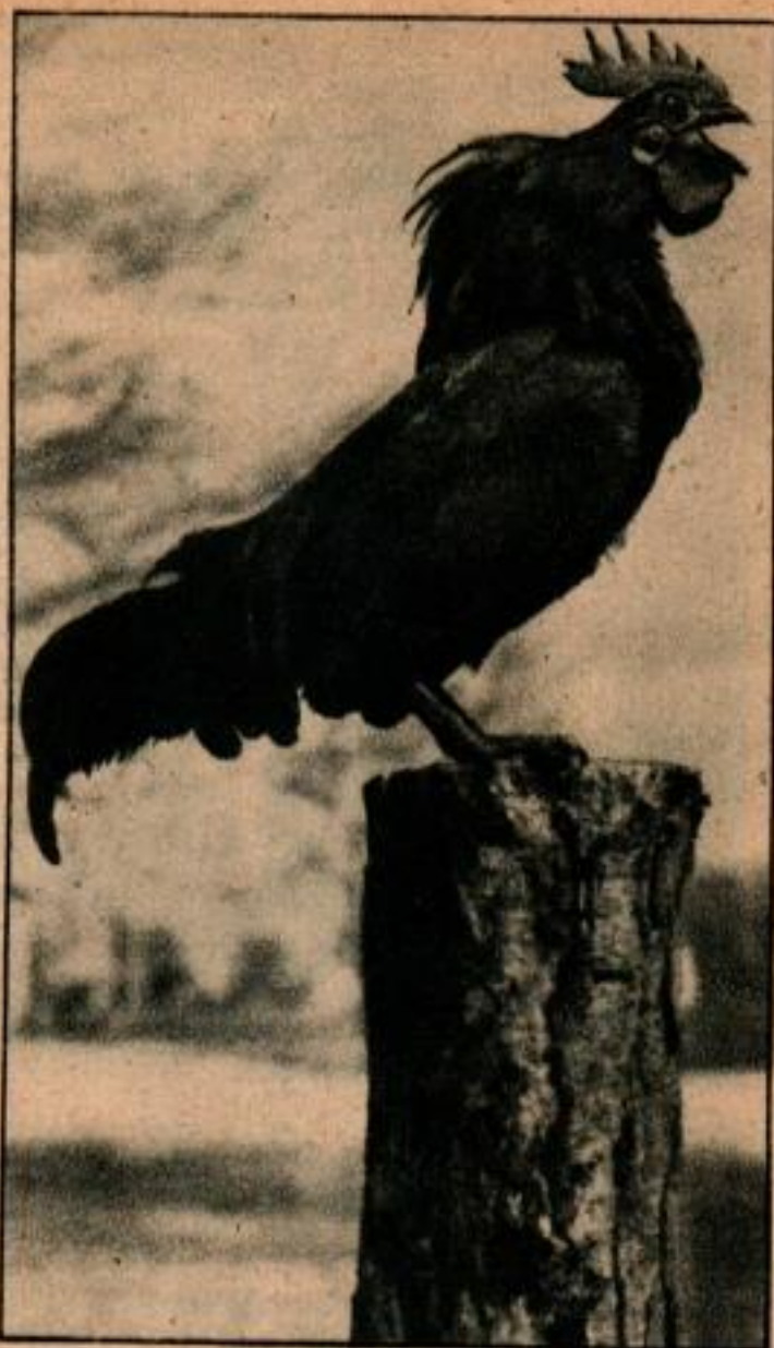
Ci-dessus, ce n'est qu'une photo et cependant vous entendez presque chanter le coq, tant la pose et le mouvement sont naturels. Une telle photo demande du temps et de la patience. Ci-dessous, il n'y a rien d'étonnant à ce que ce potiron ait reçu le ruban bleu.