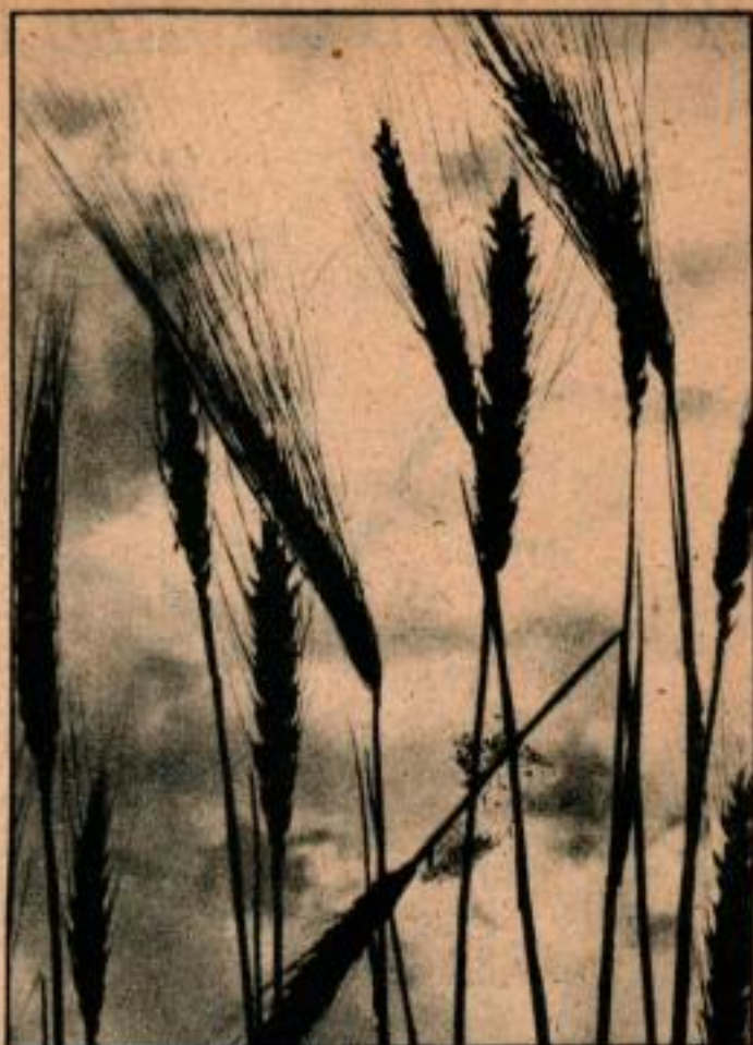
Voici une photo comme celles qu'aiment les éditeurs d'agriculture — histoire sur les méthodes surannées de faire pousser les céréales ou sujets analogues. Noter le faible angle de prise de vue et le ciel nuageux.

prise. Sur les photos artistiques, où le détail éloigné doit être enregistré, utiliser de faibles vitesses du déclencheur et la plus petite ouverture jusqu'à f: 32 dans certains cas. Pour ce travail, il est utile d'avoir un pied. La dimension du film peut être quelconque au-dessus de 35 mm., mais les photographes utilisent les plus grands formats, 9 \times 12 ou 13 \times 18 , qui donnent des épreuves de taille acceptable. Le format 9 \times 12 est probablement le meilleur pour le travail de toute catégorie. La plupart des appareils de ce format sont facilement transportables, ont un verre dépoli et sont munis de lentilles mobiles rendant possible le changement rapide des lentilles pour prendre un mouvement extrêmement rapide et avoir un grand angle d'ouverture.