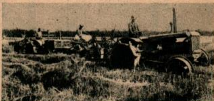
Ci-dessus et ci-dessous, photo de travail prises sans que les sujets aient fait attention au photographe ou à son appareil. De telles photos sont presque toujours l'occasion de belles ventes pour des revues agricoles.

Chaque fois que cela est possible, prendre quelqu'un accomplissant un travail typique de la vie agricole de chaque jour. Les photos de travail ou de jeu présentent toujours un intérêt à la fois pour les fermiers et pour ceux qui s'intéressent aux activités agricoles. Même des scènes et des photos souvenirs seront rendues plus intéressantes pour le photographe et ses amis si elles renferment une silhouette qui ne cache pas tout.