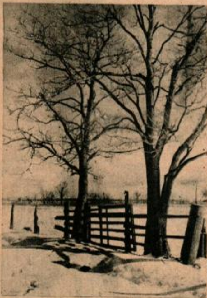
Il n'y a pas de silhouette dans cette photo d'hiver d'une barrière de pâturage, mais sa qualité artistique demande une belle technique de la photographie. Un ciel surchargé de nuage donne la promesse de plus de neige encore.