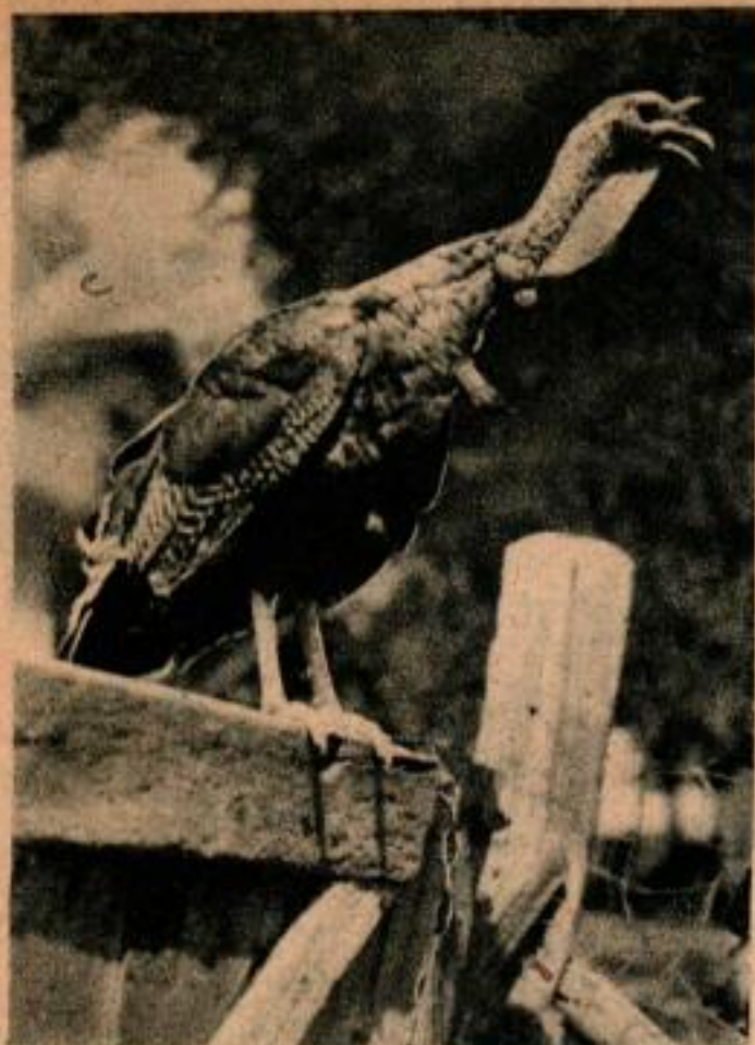
Ce dindon, bien que pas très sûr au sujet de tout le processus, a très manifestement décidé de prendre la pose juste pour voir ce qui allait arriver.