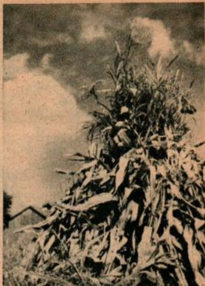
C'est la moisson — c'est la simple légende de cette photo. Remarquer les nuages et les ombres franches sur la gerbe de maïs. Un filtre jaune permet d'obtenir ce rendu.