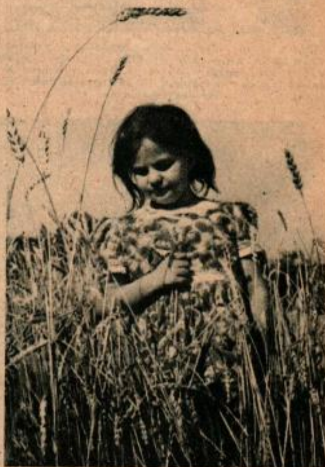
Amicalement, les photographes obtiennent la collaboration totale des enfants de la ferme. Ils aiment poser pour les photos. Les placer dans un décor familier avec quelque chose à faire.