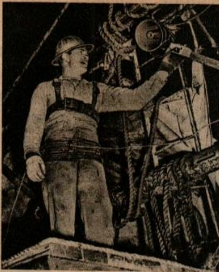
Malgré le bruit, l'ouvrier placé dans les hauteurs de la tour de forage peut utiliser le système d'intercommunication pour parler au foreur (ci-dessous) que l'on voit manœuvrer son commutateur pour envoyer des ordres.

LES installations modernes de forage des puits de pétrole deviennent de plus en plus importantes par les dimensions, le poids et le bruit qu'elles produisent, ce qui complique le problème posé par les communications entre le foreur et les autres membres de l'équipe.