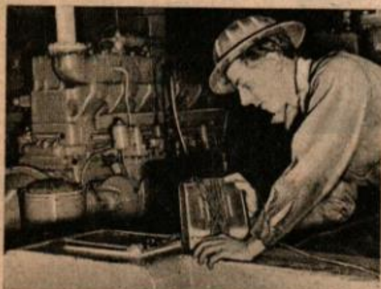
Le haut-parleur du mécanicien possède un conducteur de grande longueur permettant d'avoir l'appareil constamment à portée de la main pour recevoir les instructions du foreur. Ci-dessous, le haut-parleur installé dans le « sous-sol » évite de nombreux accidents.

D'autres postes peuvent être installés, en plus de ces 2 postes fondamentaux et se trouvent en des points importants tels que