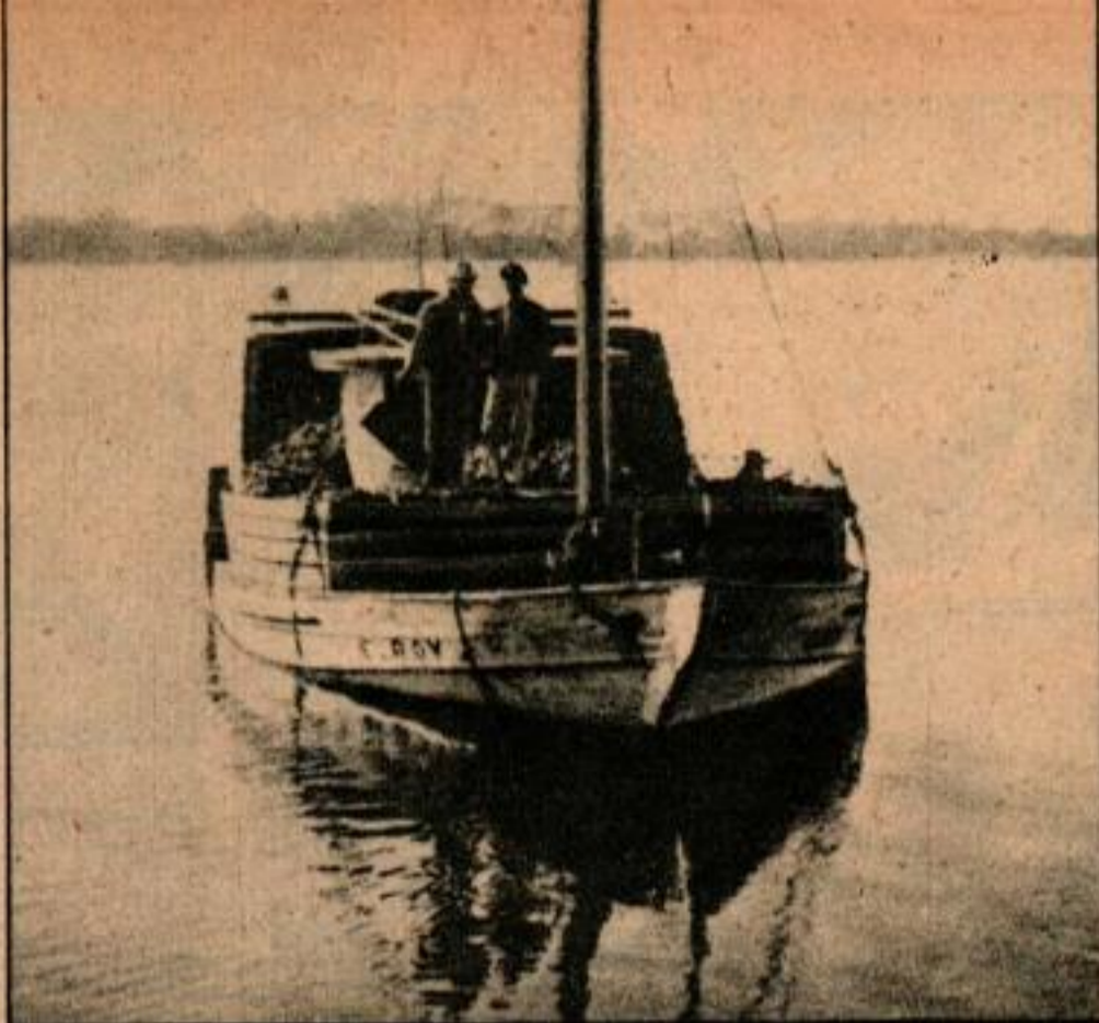
L'Elroy se rapproche du dock avec une charge de 30 tonnes d'huîtres dans sa cale. Il faut trois jours pour remplir le bateau.