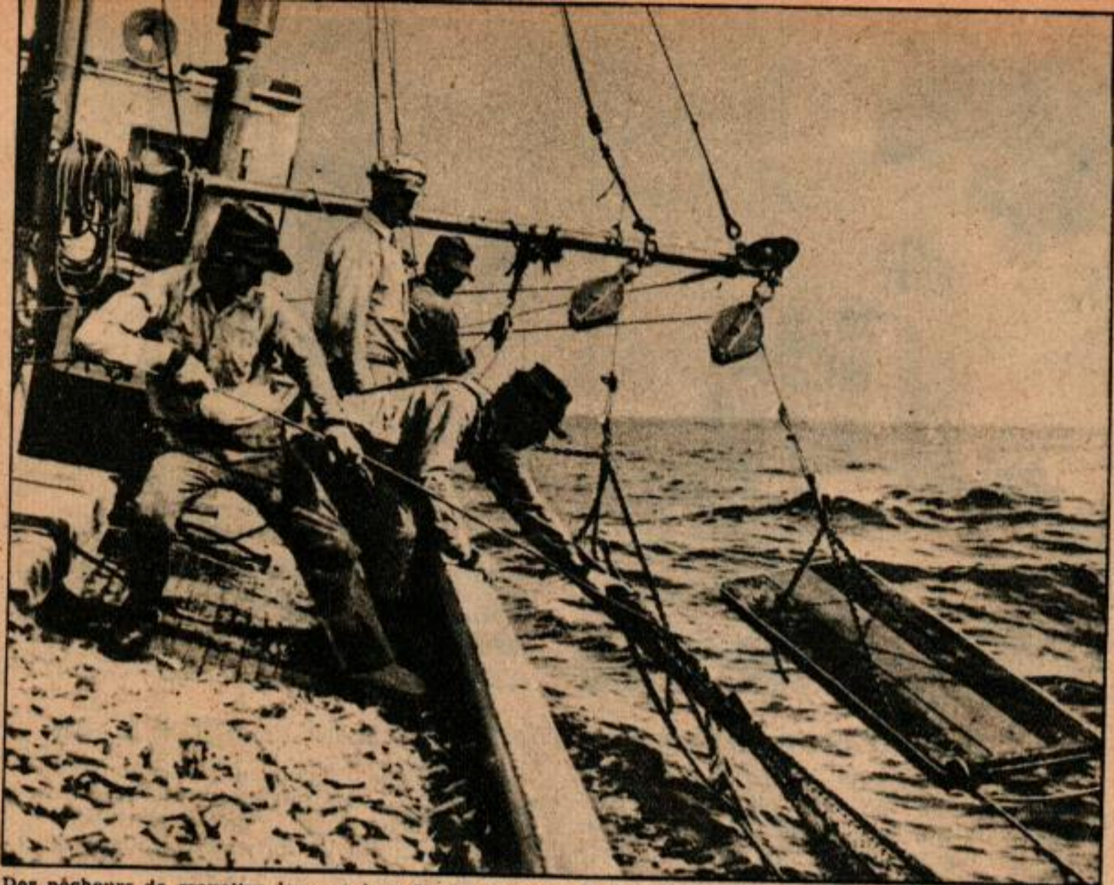
Des pêcheurs de crevettes lancent leur filet au large de la Louisiane; la planche attachée à la remorque pousse le filet vers le fond.