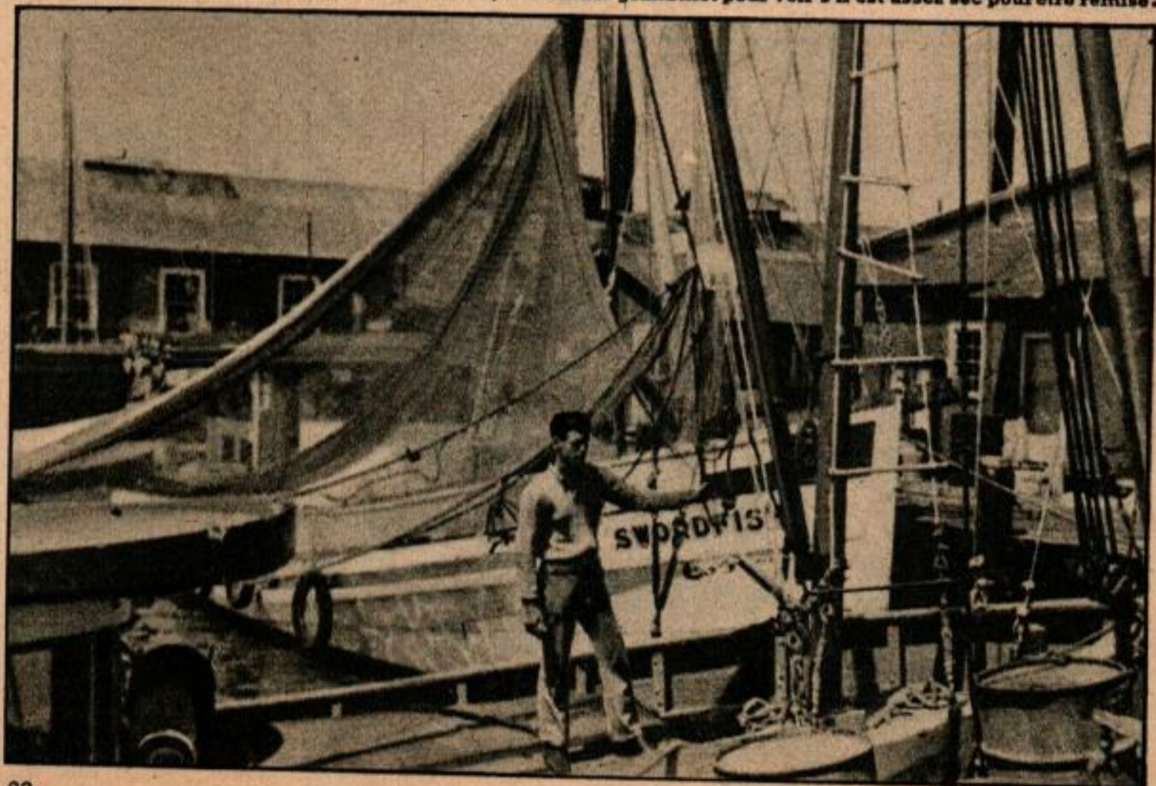
Bill Kennerson, pêcheur de crevettes de Biloxi, tâte un des grand filet pour voir s'il est assez sec pour être remisé.

Les bancs d'huîtres le long du golfe sont surveillés de près par les administrations des différents États riverains. Certains parcs sont loués à des éleveurs qui plantent des coquilles, du gra-