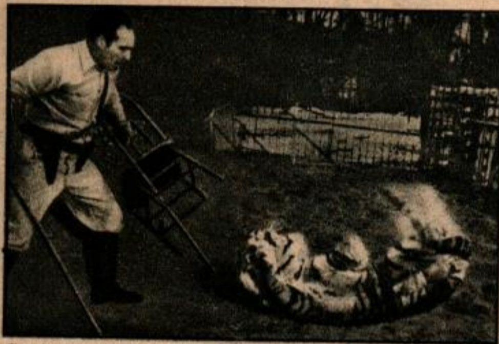
Ce n'est pas facile d'apprendre à un tigre à se rouler par terre au commandement.