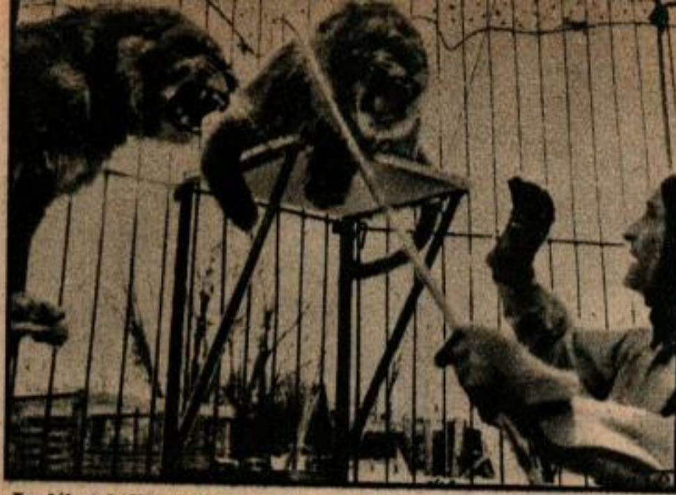
Au début de l'entraînement Clemens ouvre ses doigts quand les lions rugissent. Plus tard les félins rugissent chaque fois qu'il ouvre les doigts.