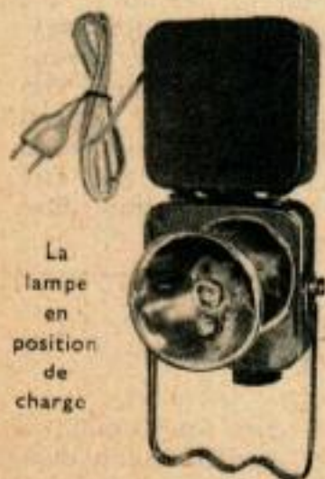
La lampe en position de charge

Une méthode recommandée pour éliminer le danger d'un point chaud sur le châssis, consiste dans l'installation de prises murales polarisées, dans tous les endroits où on a des chances d'utiliser le récepteur, avec l'emploi simultané d'un cordon polarisé à l'une des extrémités du cordon d'alimentation du récepteur. Avec cette méthode, on ne peut enfoncer la prise que d'une seule manière correspondant à la mise à la masse commune du châssis et du secteur, et tout danger est écarté. Cependant, une prise de courant murale ainsi modifiée ne peut être utilisée avec n'importe quel appareil électrique équipé avec des prises enfichables normalisées.