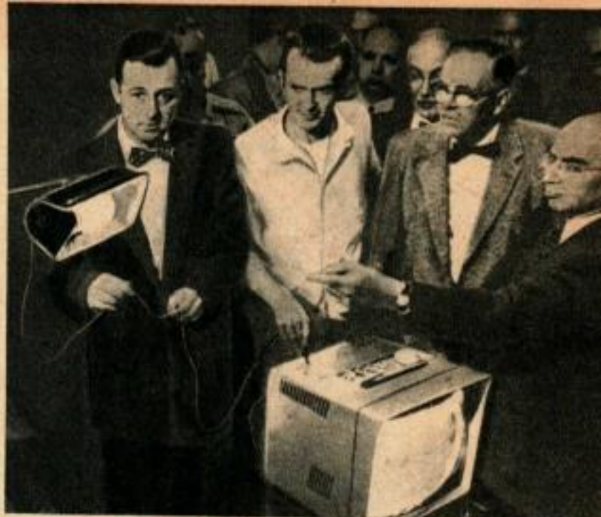
Des techniciens font la démonstration d'un boîtier métallique chargé de récepteur de télévision défectueux, pouvant allumer la lampe. Un contact simultané entre le boîtier et un objet mis à la masse pourrait être fatal.

Dans les premiers jours de la télévision, on utilisait des tubes électroniques ordinaires pour tous les circuits de télévision. Ceci imposait une tension plaque relativement élevée pour avoir un fonctionnement correct et l'emploi d'un transformateur d'alimentation élevant la tension secteur à la valeur correcte. Cependant, le transformateur faisait plus que cela. Il isolait effectivement du réseau le châssis métallique du récepteur de télévision, qui fait partie du circuit électrique du récepteur, de sorte que le châssis était neutre et ne pouvait acquérir de charge électrique. Mais avec le progrès, vinrent de nouveaux tubes capables de fonctionner à des tensions plus basses et