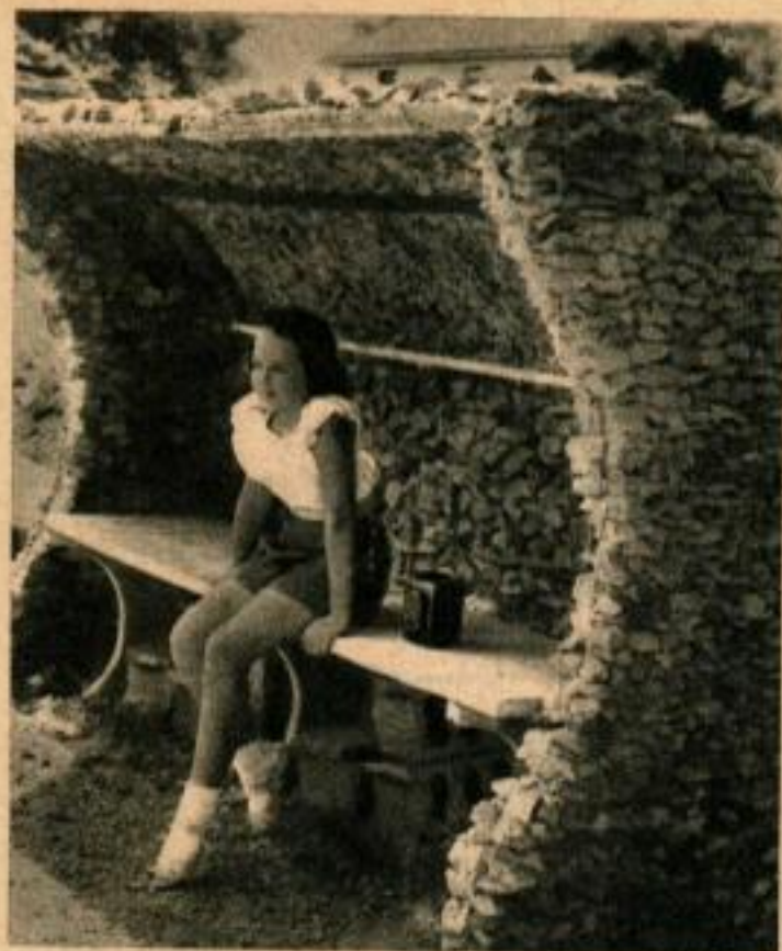
Le squelette de l'abri recouvrant ce banc de jardin est en grillage de poulailler. Ci-dessous: Ce cœur percé d'une flèche de Cupidon, mesurant 3 mètres de haut, a servi d'autel pour de nombreux mariages. Au bas de la page: vue de quelques-unes des clôtures en pierre.