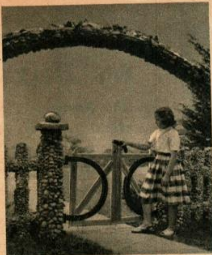
Le portail de l'une des entrées des jardins des Martin est surmonté d'une arche impressionnante. L'armature en fer de celle-ci a été recouverte de béton, dans lequel ont été enfoncées, avec grand soin, des rocailles de diverses formes, couleurs et dimensions.