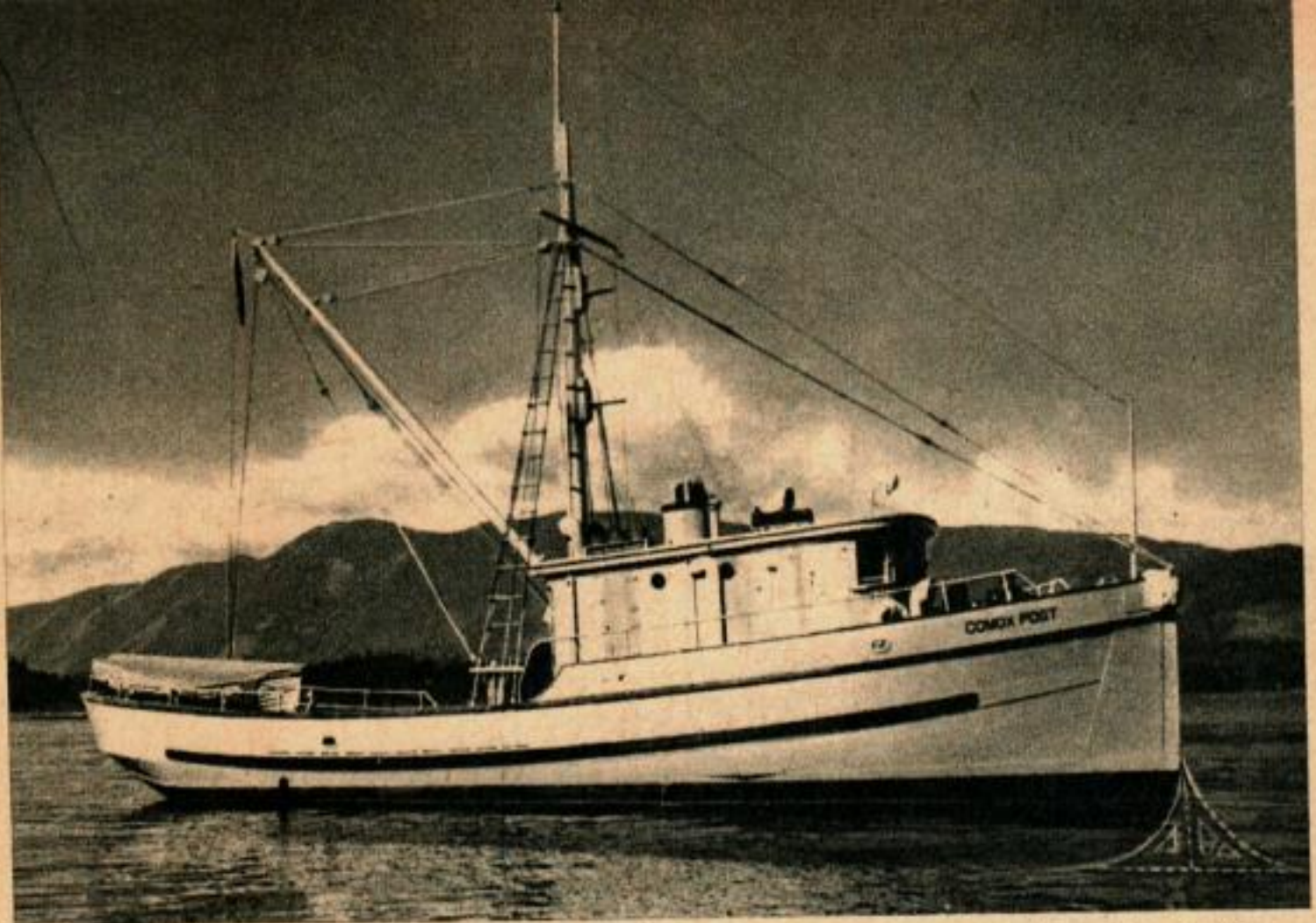
Sur la proue du Comox Post, navire des Pêcheries canadiennes, des pointillés indiquent le contour de l'éperon à requins.

L ES requins qui se chauffent au soleil, et qui sont la terreur des pêcheries de saumons situées le long des côtes de la Colombie britannique, sont chassés et éperonnés par un navire dont la proue est armée d'un éperon en forme de couteau.