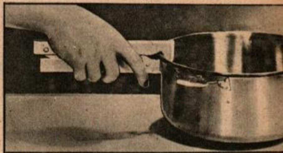
Il est facile de porter des casseroles brûlantes, des flacons et des boîtes de conserve avec ces pinces en aluminium. Ci-dessous, support de draperies pourvu de fentes et permettant d'obtenir des courbes gracieuses et majestueuses.