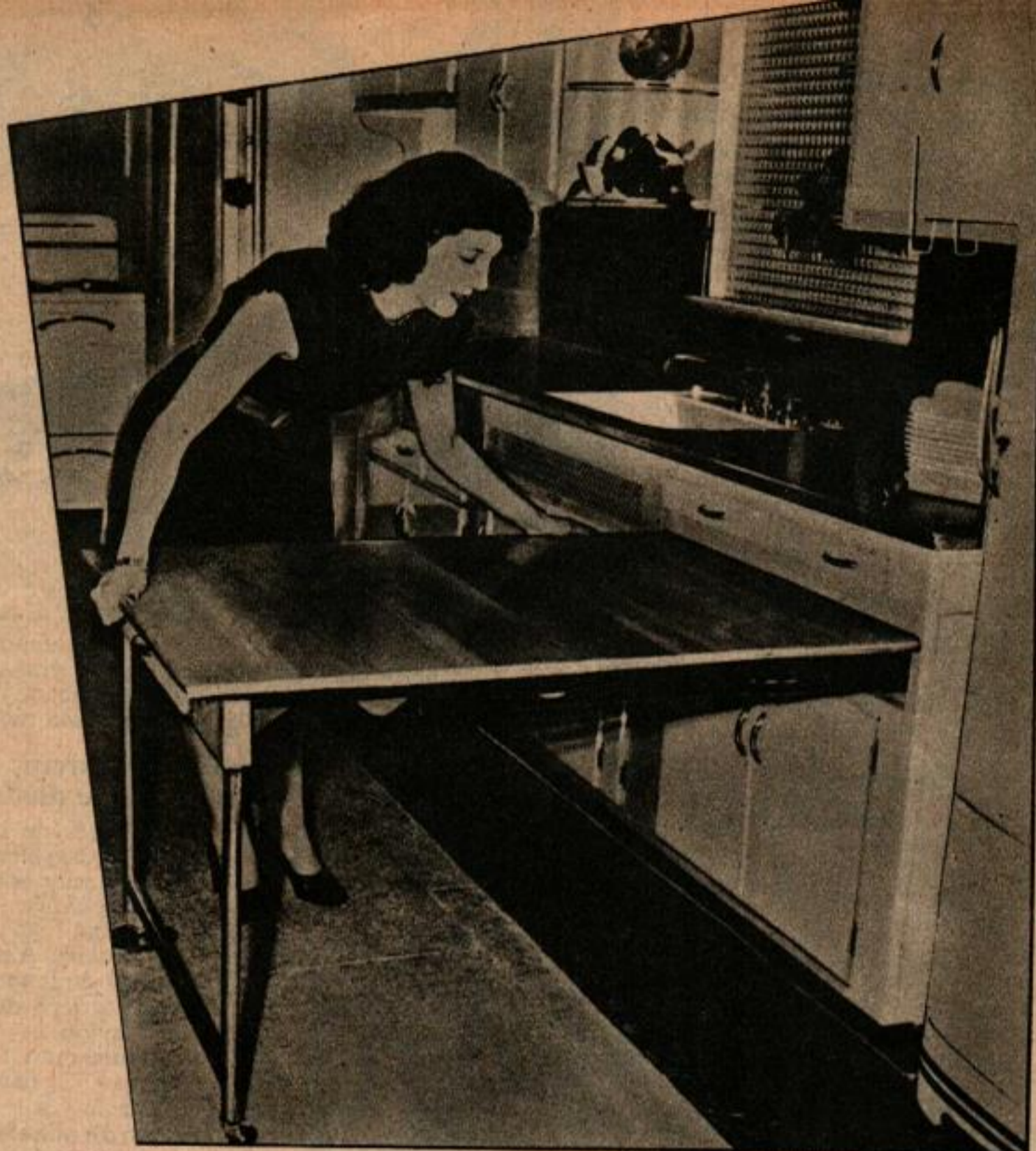
Table de cuisine escamotable rentrant dans un placard ou sous un évier. Elle peut servir pour cinq personnes. Ci-dessus, on peut placer six moules dans ce support étudié pour la réfrigérateur.