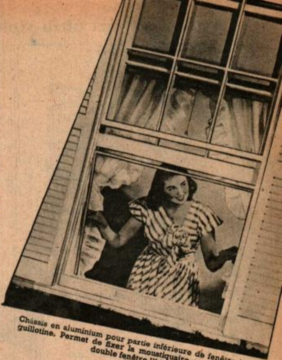
Chassis en aluminium pour partie inférieure de fenêtre à guillotine. Permet de fixer la moustiquaire en été et la double fenêtre l'hiver.